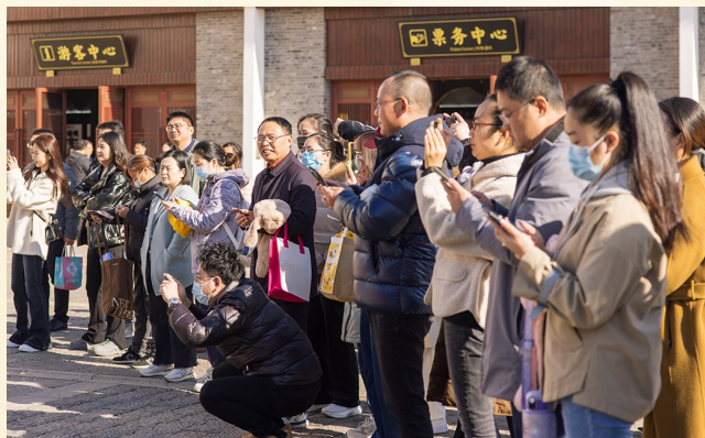
家长为孩子们留影。