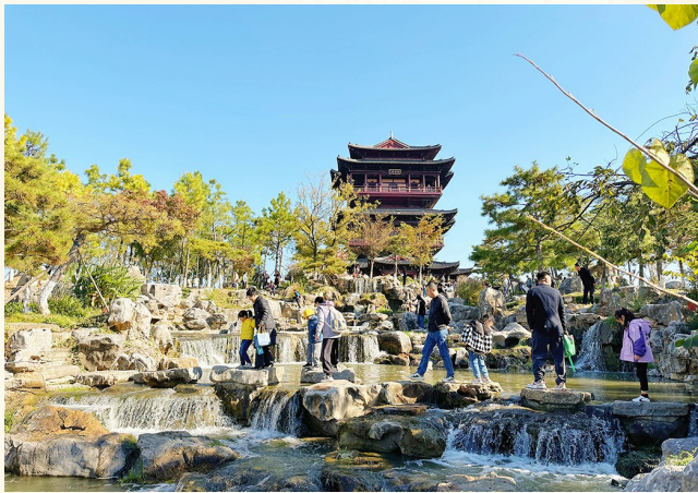
家长孩子游玩兴致高。

当天,串场河小学的晚报小记者与家长在这里进行亲子活动,坐了游船,探寻了美景,品尝了美食,学习了国学文化,度过了一个愉快的假日,受益匪浅,很是开心。