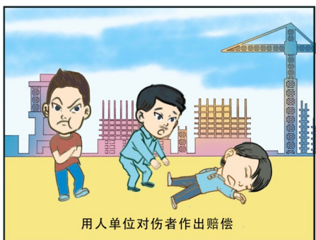
用人单位对伤者作出赔偿