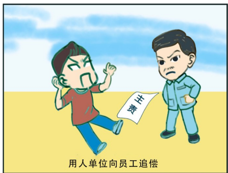
用人单位向员工追偿