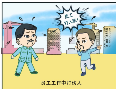
员工工作中打伤人

原告是一家船舶公司,被告是该公司的一名船员。被告在履行工作职责的过程中与他人产生冲突,将他人打伤。用人单位在对伤者承担赔偿责任后,向船员进行追偿。法院判决认为,冲突的起因虽然是工作,但船员打人的行为完全超出了自己的工作范围和采取措施的合理限度,属于故意致人损害的情形,对于该行为造成的主要后果应当由船员承担;船舶公司对其员工疏于管理和教育,应当对该起打人事件造成的损失承担次要责任。法院最终判决船员对造成的损失承担六成责任。