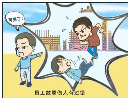
员工故意伤人有过错