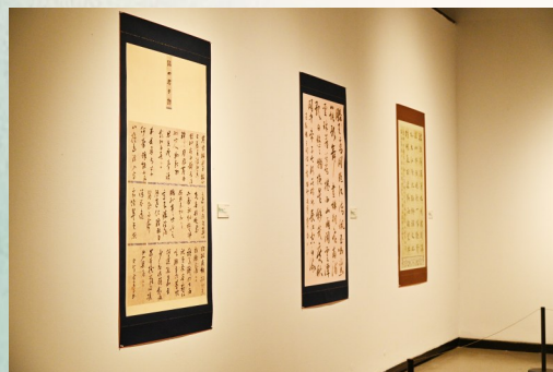
2023中韩(盐城)书画交流展部分作品