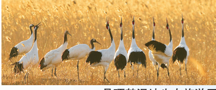
丹顶鹤湿地生态旅游区