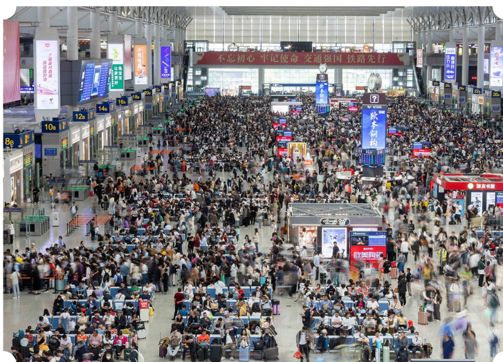
10月6日,上海虹桥火车站候车大厅里人头攒动。当日是中秋、国庆长假的最后一天,全国各地迎来返程高峰。