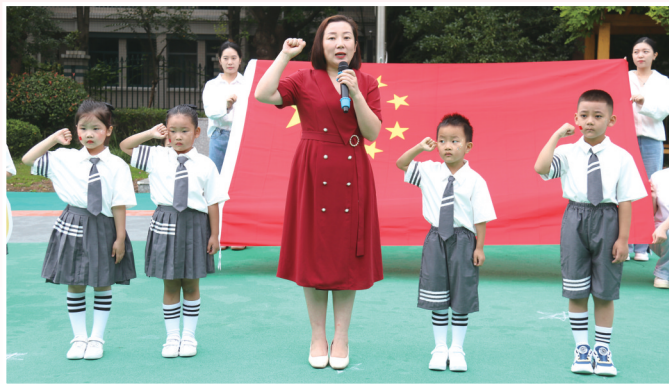
市六 一幼儿园的 孩子们在老 师的带领 下向国旗 宣誓。