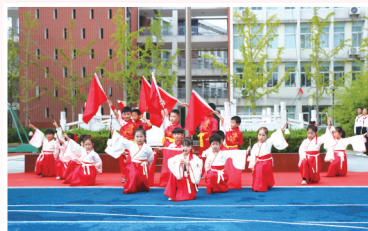
日月路小学学生表演的歌舞《千字文》。

话、感党恩、跟党走”的思想自觉和行动自觉。宣誓结束后，盐城市关工委常务副主任葛传华在盐城市一小向全体师生发出寄语，他希望青少年要自强，希望孩子们心怀“国之大人”，“好好学习，天天向上”，努力成长为德智体美劳全面发展的社会主义建设者，为推进中国式现代化贡献青春力量；为师者要作表率，广大教育工作者，要坚持立德树人，为孩子们系好“人生第一粒纽扣”。