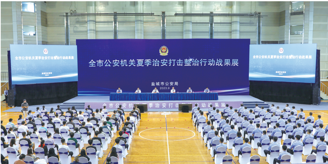
▲盐城公安召开全市公安机关夏季治安打击整治行动战果展。

刑事警情数、立案数双下降,破案数、抓获嫌疑人数双上升,抓获一批历年逃犯、打掉一批犯罪团伙、摧毁一批犯罪窝点……9月23日下午,江苏省盐城市公安局举行全市公安机关夏季治安打击整治行动战果展,现场发布盐城公安守护夏季平安成绩单,并向24名群众代表返还追回的价值2000余万元财物,让盐阜百姓享受夏季治安打击整治行动的红利。 民有所呼,警有所应。盐城公安坚持以群众满意为评判工作成效“金标准”,聚焦群众所需所想,深入开展夏季治安打击整治行动,以主动姿态、务实举措,全力擦亮平安底色、增强安全韧性,让盐阜百姓的安全感更加充实、更有保障、更可持续。