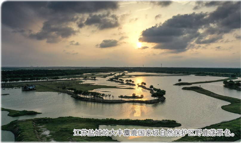
江苏盐城的大丰麋鹿国家级自然保护区野鹿荡景色。