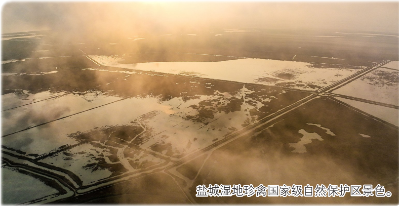
盐城湿地珍禽国家级自然保护区景色。