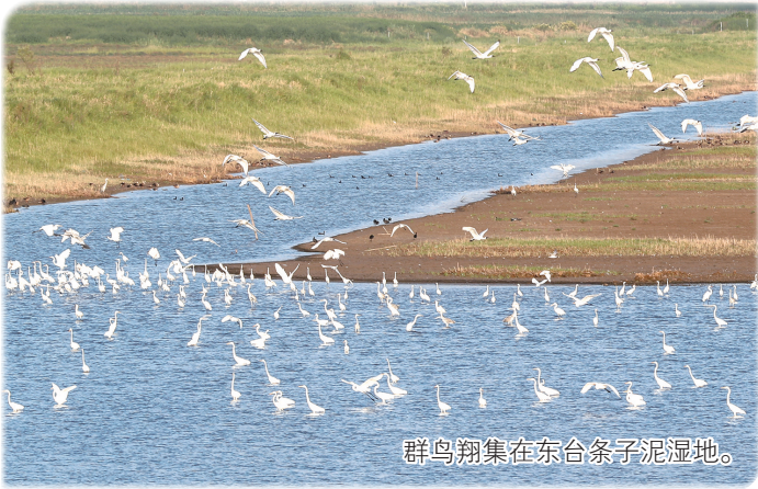
群鸟翔集在东合条子泥湿地。