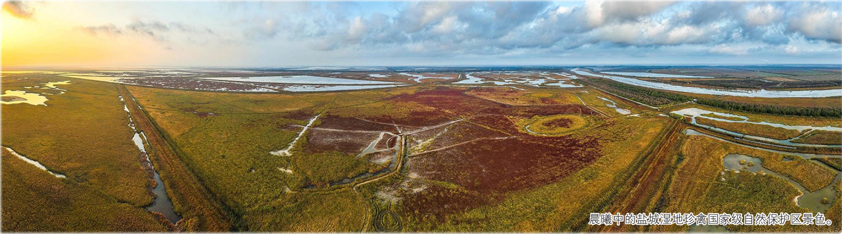
晨曦中的盐城湿地珍禽国家级自然保护区景色。