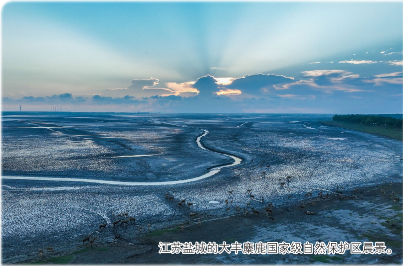
江苏盐城的大丰麋鹿国家级自然保护区晨景。