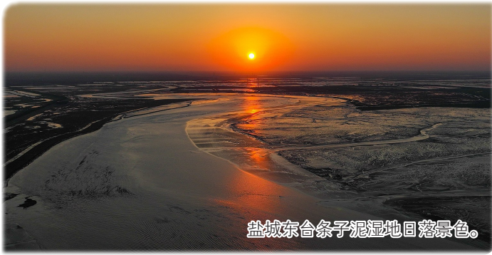
盐城东合条子泥湿地日落景色。