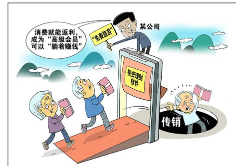
传销骗局 朱慧卿 作