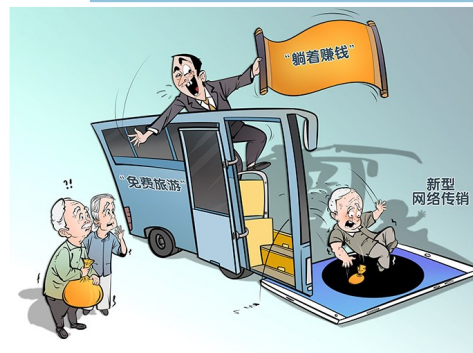
警惕新型网络传销 曹一作