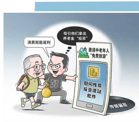
“免费旅游”骗局 程硕 作