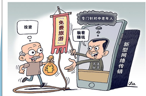
传销圈套 徐骏 作