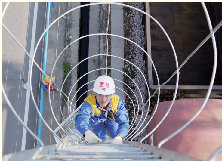
8月29日,中国铁路郑州局集团有限公司郑州供电段工作人员在郑州北站编组场内攀爬灯桥。