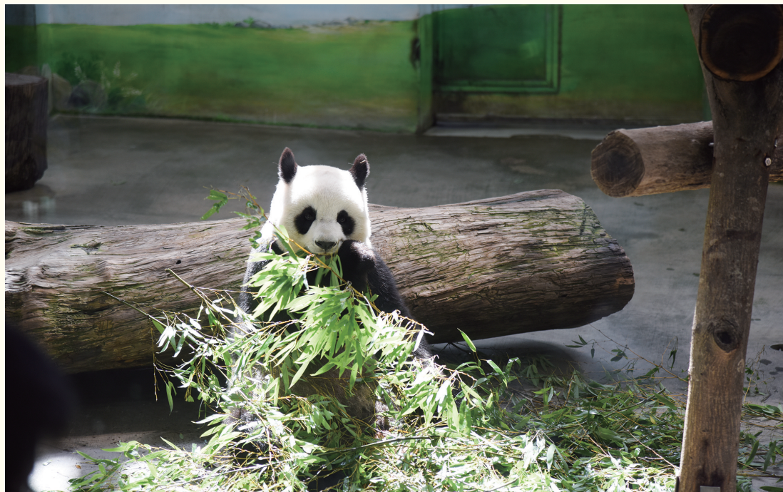
8月30日,大熊猫“圆圆”在台北市动物园吃竹子。

大陆赠台大熊猫“圆圆”迎来19岁生日。8月30日,大熊猫“圆圆”在台北市动物园品尝“生日蛋糕”。