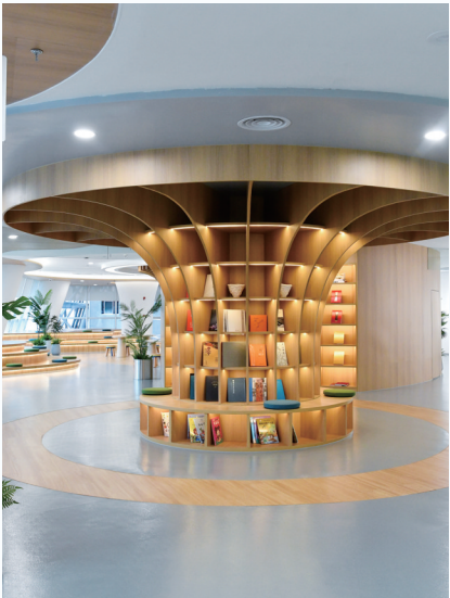
生态园内配套建设的环保书吧。