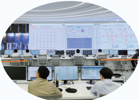
实时监测垃圾焚烧和烟气排放情况。

近年来,深圳创新“能源生态园”建设模式,以超欧盟标准建设多座能源生态园,在国内大城市中率先实现生活垃圾分流分类后全量焚烧,变“邻避设施”为市民游客争相参观的“网红打卡地”。 深圳龙岗能源生态园占地面积约54万平方米,日处理生活垃圾5000吨,是目前国内单体建设规模最大的超大型生活垃圾焚烧处理设施。