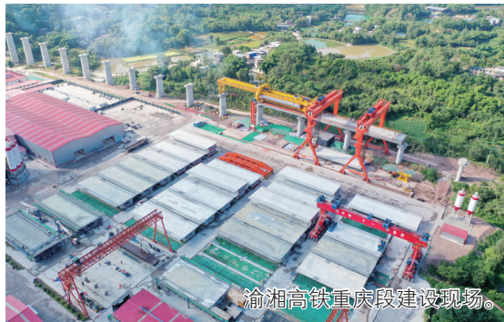
渝湘高铁重庆段建设现场。