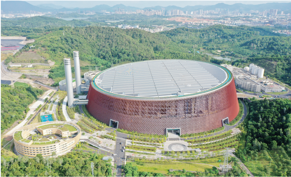
深圳龙岗能源生态园远景。