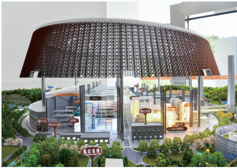
内部设施演示模型。