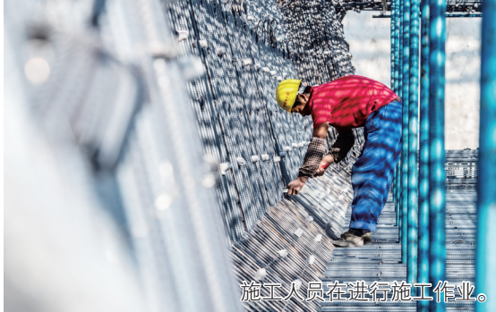
施工人员进行施工作业。