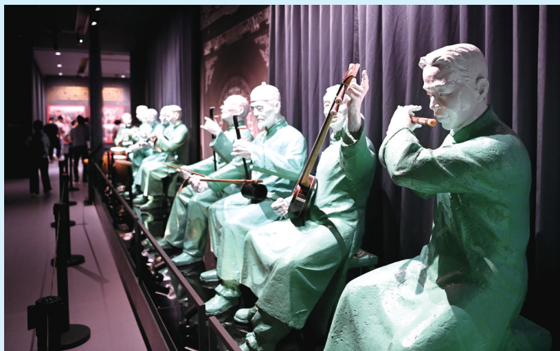
中国秦腔艺术博物馆里展示的戏曲艺人雕塑。