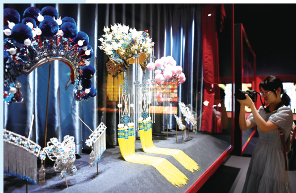
参观者在中国秦腔艺术博物馆里拍摄。