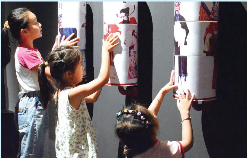
小朋友在中国秦腔艺术博物馆里感受游戏互动装置。