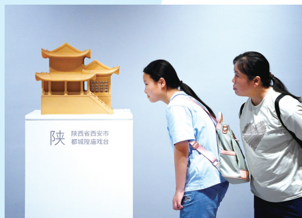
参观者在中国秦腔艺术博物馆里观看微缩戏楼里播放的秦腔演出选段。