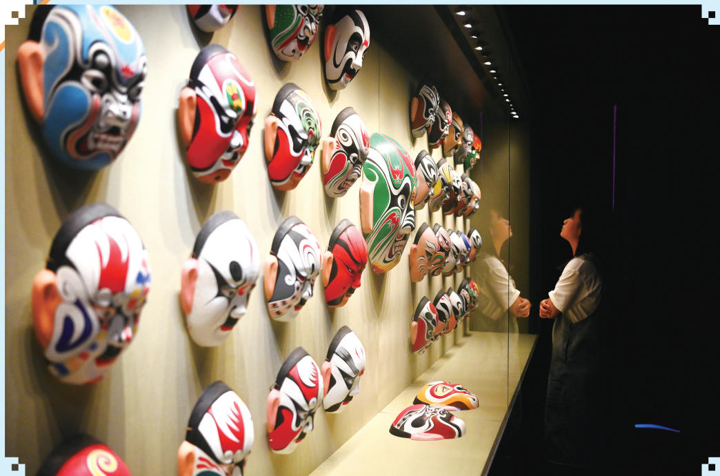
参观者在中国秦腔艺术博物馆里观展(8月8日摄)。

近日,位于陕西省西安市易俗社文化街区的中国秦腔艺术博物馆迎来暑期参观热潮,人们纷纷走进馆内感受秦腔这一传统戏曲的魅力。