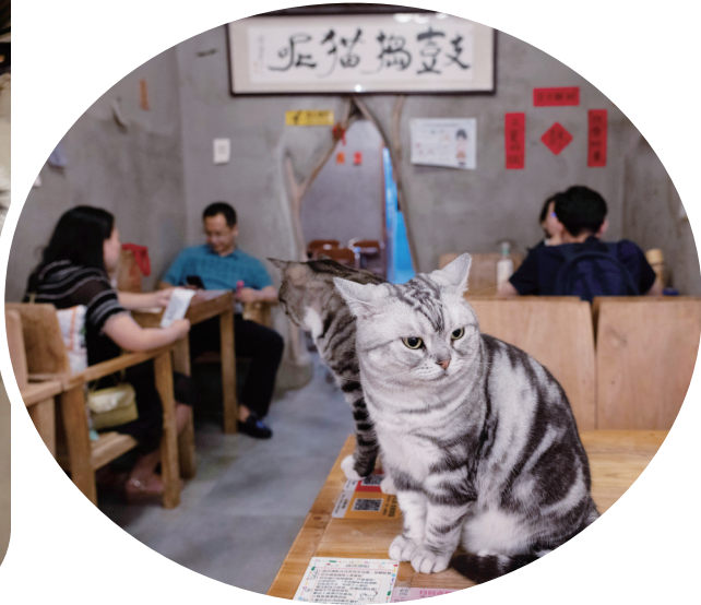
猫咪“小小美”(前)最喜欢在这张桌子上睡觉,这张桌子的桌号就叫“小小美桌”。