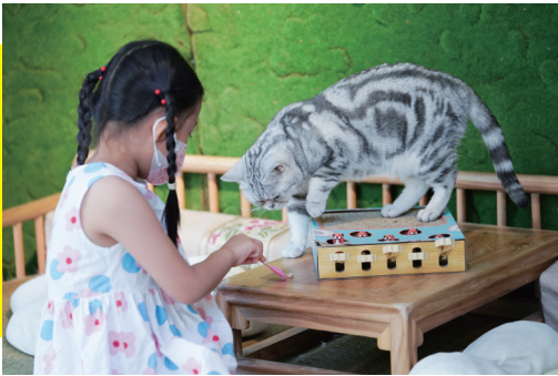
女孩与猫咪“尾牙”互动。