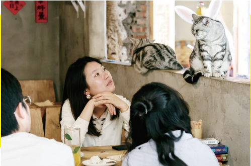
猫咪“小小美”与顾客对视。