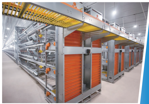
标准化层叠式笼养蛋鸡舍