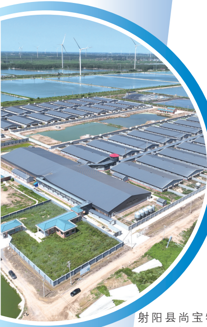
射阳县尚宝牧业第四猪场