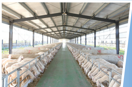
江苏乾宝牧业有限公司标准化羊舍内景