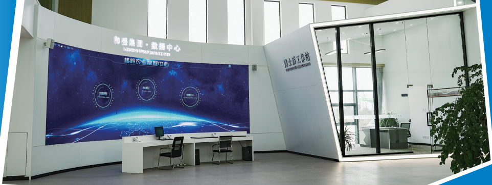
盐城栖岭农业科技公司的数据中心