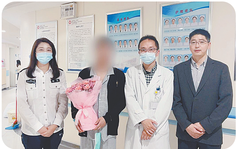
快速救援,让患者赢得新生。

拉了回来。我自己也是学医的,非常清楚这个疾病的凶险程度,分秒之差可能就救不回来啦!120的医生能在短时间内作出诊断并果断正确处置,这么精湛的业务能力让我非常钦佩,你们诠释了什么叫救死扶伤!”