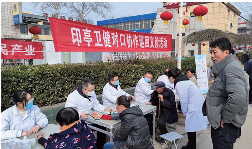
捐赠仪式及义诊现场。

作方案,即“捐赠一批紧缺物资、帮扶一批诊疗设备、助力一同上门巡诊、开展一轮巡回义诊、组织一场业务交流、拓展一波消费帮扶。”