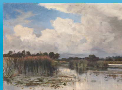
《东盎格鲁沼泽》 基利·霍尔斯特