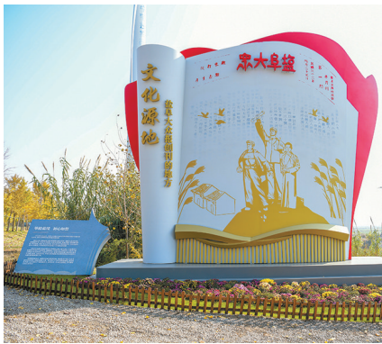
▲文化源地雕塑:盐阜大众报创刊的地方。 ▲盐阜大众报旧址陈列馆奠基仪式现场。