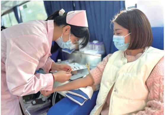
11月14日,盐都区盐渎街道网格中心开展无偿献血活动,全体工作人员踊跃报名参加,纷纷撸起袖子参与无偿献血,用实际行动为文明城市增添亮色。

扎,体力已严重透支,无法正常飞行。民警通过网上查询比对,确认该大鸟为成年鸮形目鸟类,也就是民间俗称的猫头鹰,是国家二级重点保护野生动物。根据猫头鹰的生活习性和食物的喜好,民警随即找来食物进行喂养,待其体力恢复后于晚间放飞自然。 近年来,随着群众对湿地保护和野生动物保护意识的提升,爱鸟护鸟已成为沿海群众的共识,东台沿海湿地环境日趋改善,已然成为鸟的天堂,形成了人与自然和谐共生的美丽画卷。 陈冬平 葛海寒 记者 宋晓华