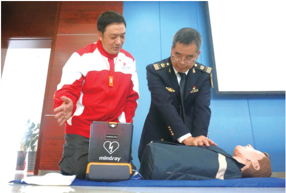
11月10日,市红十字会应邀来到盐城海事局开展救护培训,通过此次培训,提高了干部职工应对海上突发事件的自救和救援能力。

盐城晚报讯 一只大鸟夜间误入村民投放的虾笼中被困,好在被村民及时发现并报警求助,经民警上网比对确认,这只大鸟是国家重点保护的野生动物猫头鹰。 11月14日上午,东台市弢港镇村民报警称,他在弢港镇蹲门村沿海养殖区投放的虾笼中,有一只大鸟被困在里面,可能是国家保护动物,请求派出所安排警力过来处置。 接警民警将这只被困的大鸟带回派出所,经初步检查,发现该大鸟身体外表无明显伤痕,羽翼展开长度60厘米左右,但因长时间困在虾笼里挣