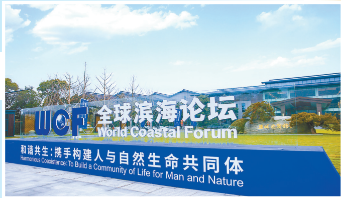
首届全球滨海论坛会议2022年1月在盐城举办