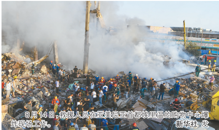
8月14日,救援人员在亚美尼亚首都埃里温的购物中心爆炸现场工作。