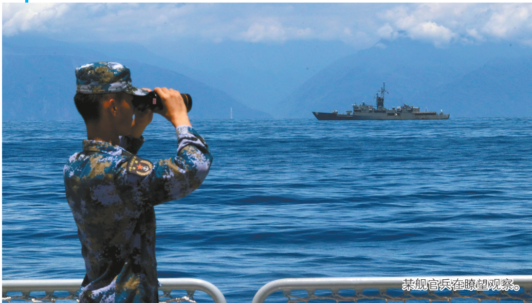
某舰官兵在瞭望观察。