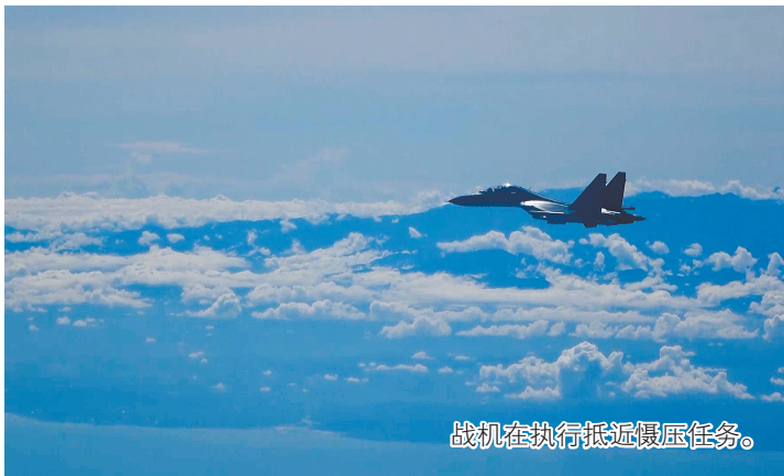
战机在执行抵近慑压任务。