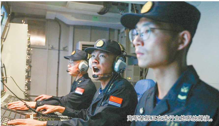
海军某舰正在进行主炮系统操演。