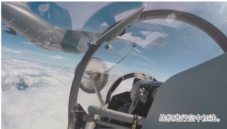
战机进行空中加油。