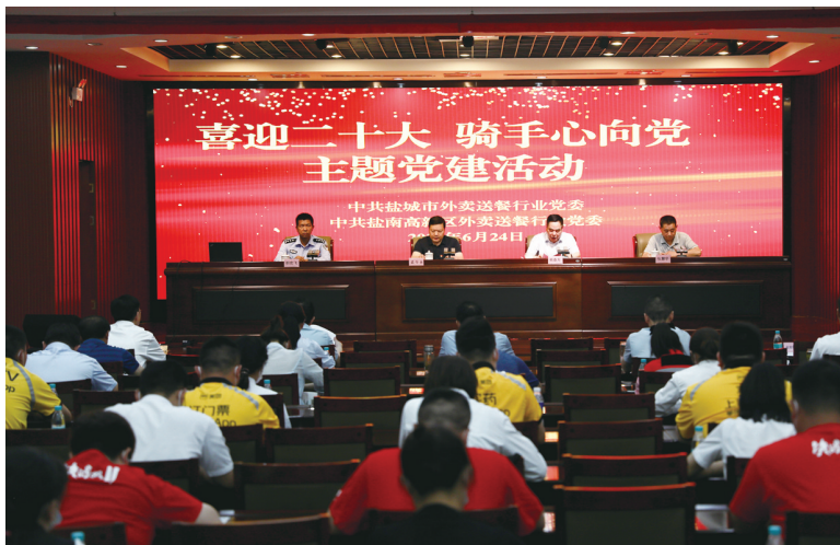
图为活动现场。

“我们每天奔波于各家外卖店,能在第一时间、第一现场看到商家出餐情况。”首批食品安全监督员之一、党员骑手刘海君告诉记者,他们不仅要