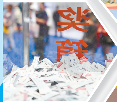
展会期间抽奖环节奖励参加活动的市民。