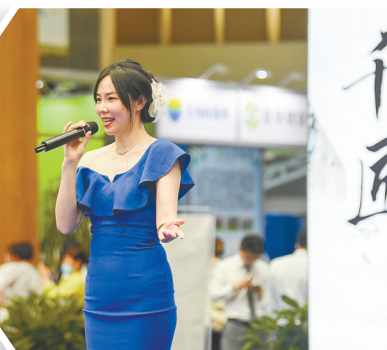
文艺工作者为房产家居博览会现场助兴。