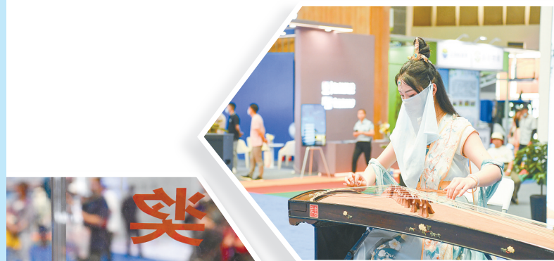
演艺人员现场演奏。