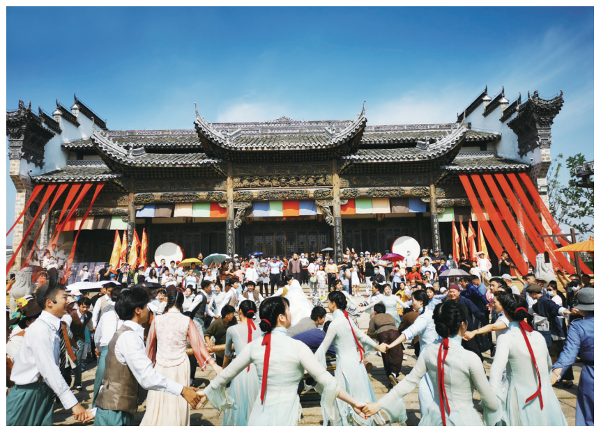
《盐渼往事》的沉浸式表演让人身临其境。(资料图)