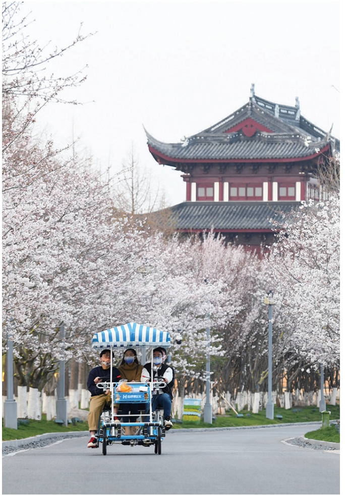
“樱”为你开,春暖盐城。

在赏樱花的同时,大洋湾唐渼里和盐渼古镇是必去打卡点。唐渼里是国内首个古韵盛唐与现代美食相融合的沉浸式体验街区,以唐文化为主线,以唐代特色建筑为景观,名小吃美食区、非遗文创区、湿地特色餐饮区和夜游区等主题街区再现盛唐繁华市井。唐渼里已成为盐城夜游景区一张靓丽名片,去年成功入选第二批江苏省省级夜间文化和旅游消费集聚区建设单位名单。淮盐出,天下咸。踏入盐渼古镇,民国风情扑面而来。坐在大戏台下,仿佛能看见昔日热闹繁华的景象,仿佛穿越到百年前的旧日时光,锣鼓喧天,丝竹盈耳。赏罢樱花,再尝一尝盐城八大碗,地道的盐城风味,为一场樱花之旅更添许多回味。