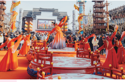
唐渼里《梦回大唐》歌舞。(资料图)