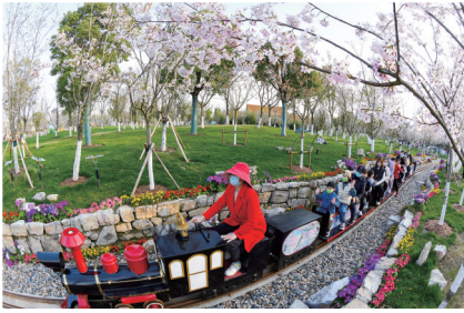
美翻了,坐小火车慢行赏樱。