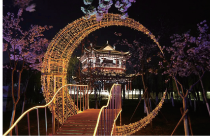
鎏金般的夜景,让人梦回盛唐。

“暖风熏得游人醉,又到一年赏樱时。盐城大洋湾簇簇樱花如期而至,一树树春光,点点在枝头,云蒸霞蔚,美轮美奂。每年三月中旬起,大洋湾景区内早、中、晚各类品种的樱花次第开放,一路热闹繁盛开到四月末,粉色浪漫,占尽春风。盐城大洋湾打造花名片,发展花经济,如今已成为长三角地区知名赏樱胜地之一。