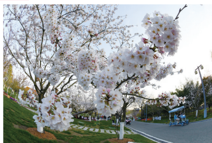
盛开的樱花如梦幻,纯粹又浪漫。