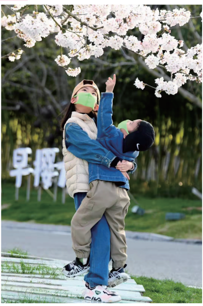
一簇簇樱花如同漂浮的云彩。