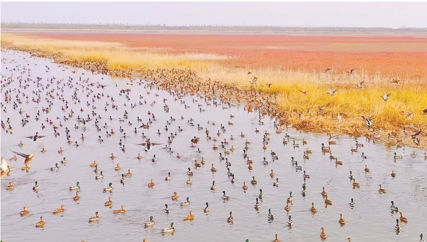
黄海之滨

“近日,江苏资深媒体人金伟忻推出新书《激荡江海五千年》。该书汇集了作者近几年来创作的14篇作品,首倡“江海文化带”概念,以江海(黄海)交融的全新视角,在“流域视野”和“千年时空”交织而成的宏阔格局下,重新审视“水韵江苏”数千年来的文明变迁、历史命运、文脉蕴积,在史观建构层面颇有独特之处。该书甫一出版,就获得了著名文学评论家丁帆、王尧,著名作家范小青、叶兆言