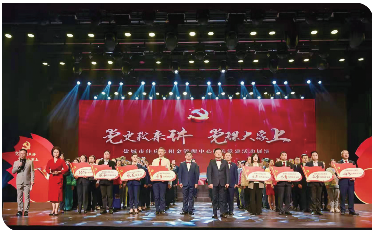
党建展演活动现场。

此外,该中心以主动履责掌握“主动权”、以教育活动筑牢“主阵地”、以广泛宣传唱响“主旋律”,运用党报党刊、网站等主流媒体和中心网站、微信公众号,广泛宣传党建工作举措亮点,以及学史力行服务群众、服务中心大局的做法、成效,去年在“学习强国”平台宣传4篇,在人民网、新华网、人民日报融媒体宣传17篇,在新华日报等省级媒体宣传29篇,在市级媒体宣传报道68篇,提高了“筑梦万家”党建服务品牌影响力。