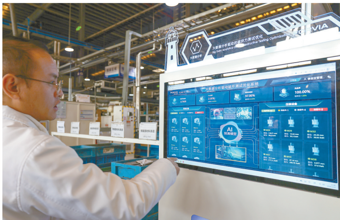
2月24日，在位于盐城经开区的佛吉亚（盐城）汽车部件系统有限公司车间内，员工正在赶制产品。该公司作为全球汽车座椅领域首家“灯塔工厂”，采用AI视觉检测系统，累计开发50余个数字化管理工具，部署40余个智能应用场景，实现AI、大数据、数字孪生、VR等前沿技术的深度应用，构建起覆盖全生产链路的动态质量管理体系。