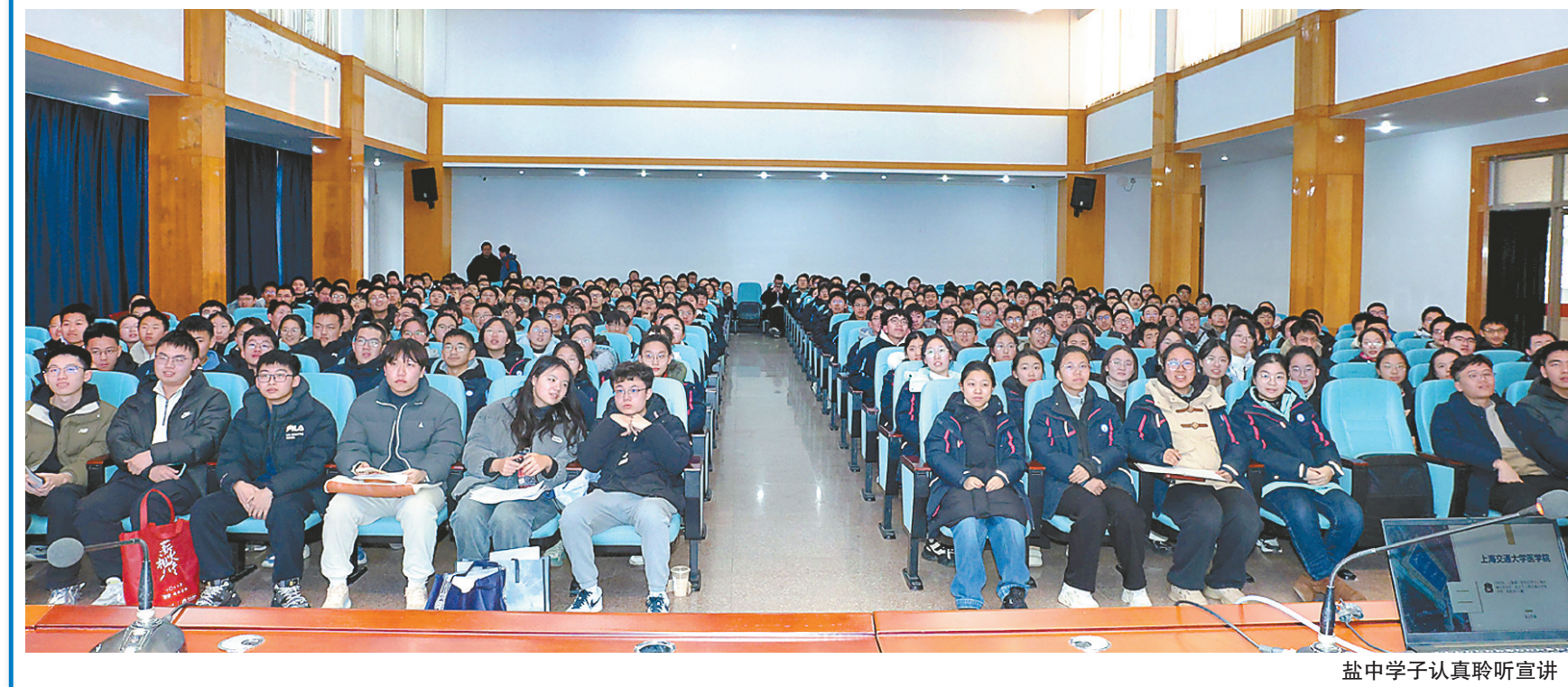
盐中中学认真聆听宣讲

目标,砥砺前行,以更加饱满的热情投入到学习中去,为实现未来的大学梦而努力奋斗!”盐中中学有关负责人表示。