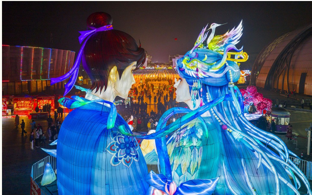
2月11日,游客在江西省新余市仙女湖新春灯会赏灯(无人机照片)。