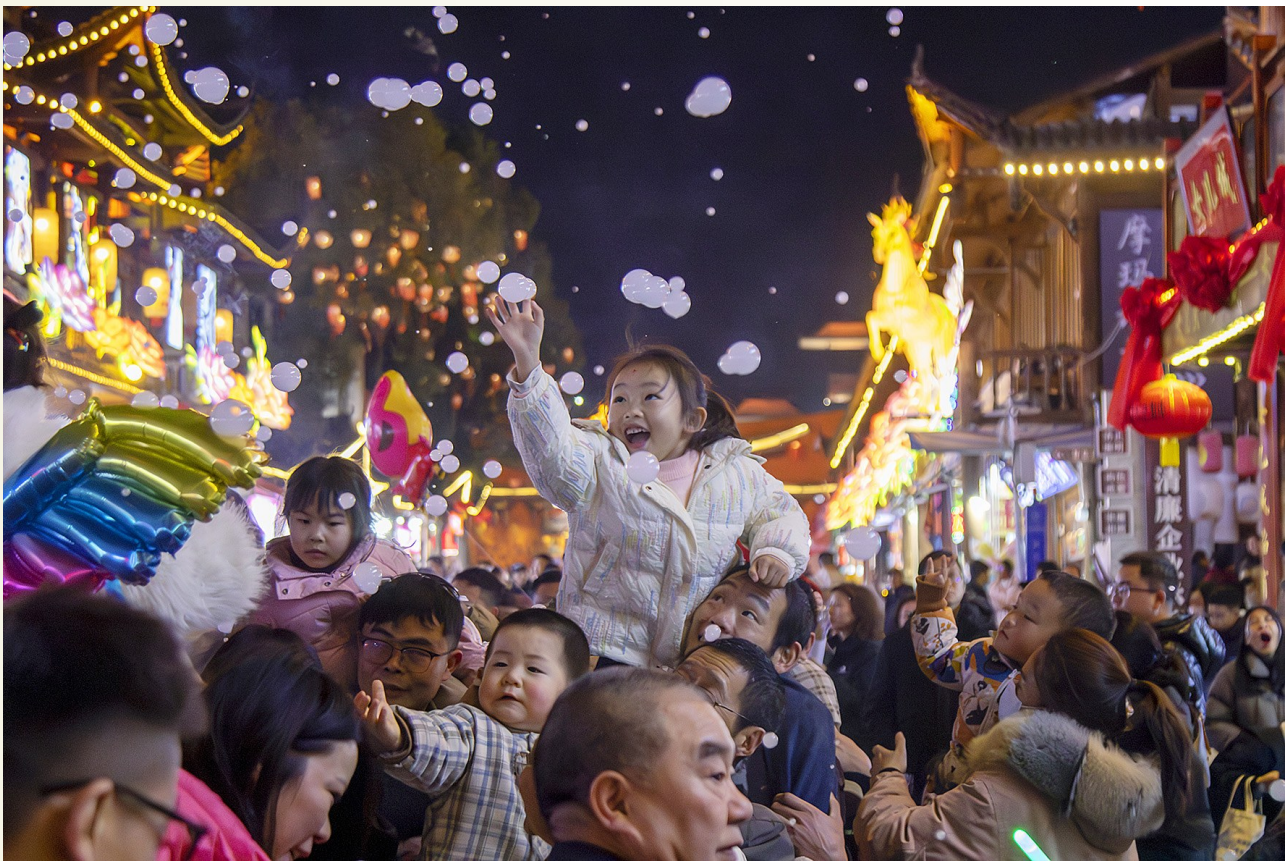
2月13日,湖北省恩施女儿城步行街人流如织。

新春临近,各地推出一系列促消费活动,吸引游客沉浸式体验传统文化,感受新春喜庆气氛,文旅市场一片火热。