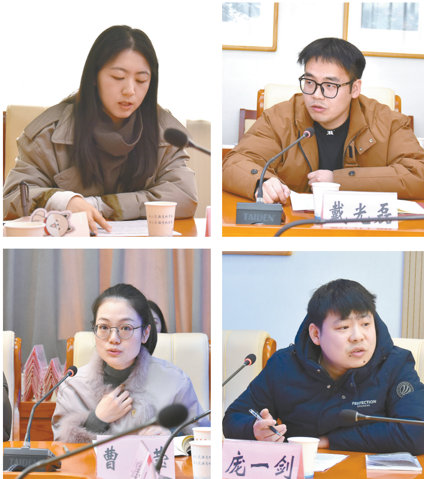
部分优秀青年人才在会上发言

青年兴则教育兴,青年强则教育强。一直以来,盐城市教育局始终把青年人才队伍建设作为教育事业发展的重中之重,未来将持续搭建“青蓝工程”“名师工作室”等成长平台,完善培训培养等保障机制,为青年人才的成长铺路搭桥、保驾护航,让每一位青年人才都能在盐城教育的沃土上安心工作、舒心成长、实现价值。