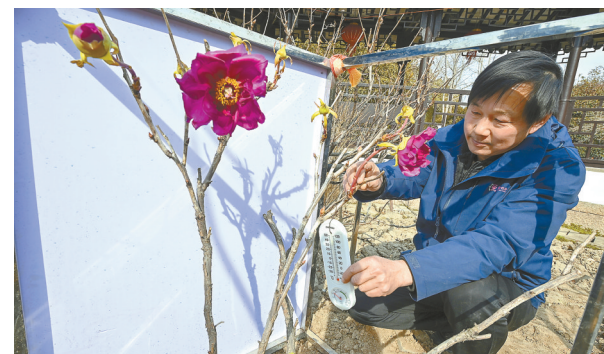
2月9日,亭湖区便仓镇的桔枝牡丹园园内,两朵紫袍牡丹花在寒风中悄然绽放,硕大的花朵镶嵌在枯枝之上,紫得发艳,随风轻轻摇曳,还有几朵花蕾含苞待放。据了解,桔枝牡丹通常在谷雨前后三天盛开。春花绽放后,它们会在6月至9月间持续进行花芽分化。一旦秋季花芽分化完成,牡丹的生长周期即告结束,进入冬季休眠期,桔枝牡丹极少在腊月绽放,这般冬日花开的景象尤为罕见。