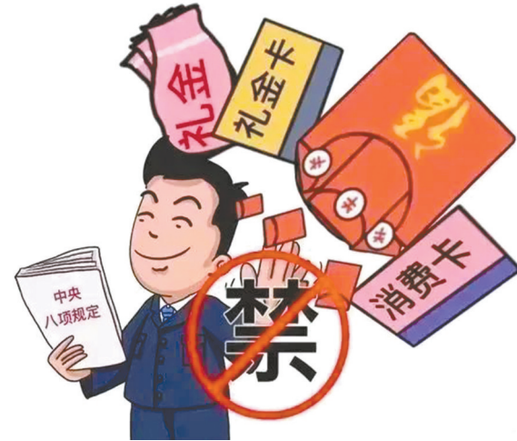
不得违规收受下属、管理和服务对象等赠送的礼品礼金和消费卡(券)等财物。