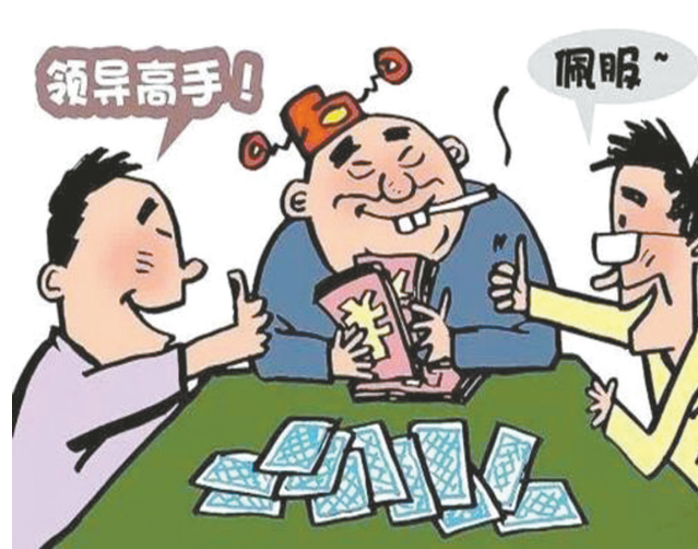
不得组织或参与“带彩”娱乐活动。