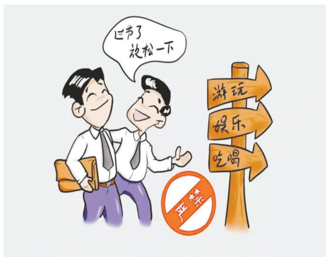
不得违规接受管理和服务对象安排的旅游活动。