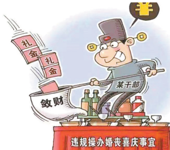
不得利用职权或职务上的影响违规操办婚丧喜庆事宜,借机敛财。