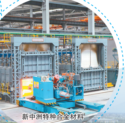
新中洲特种合金材料