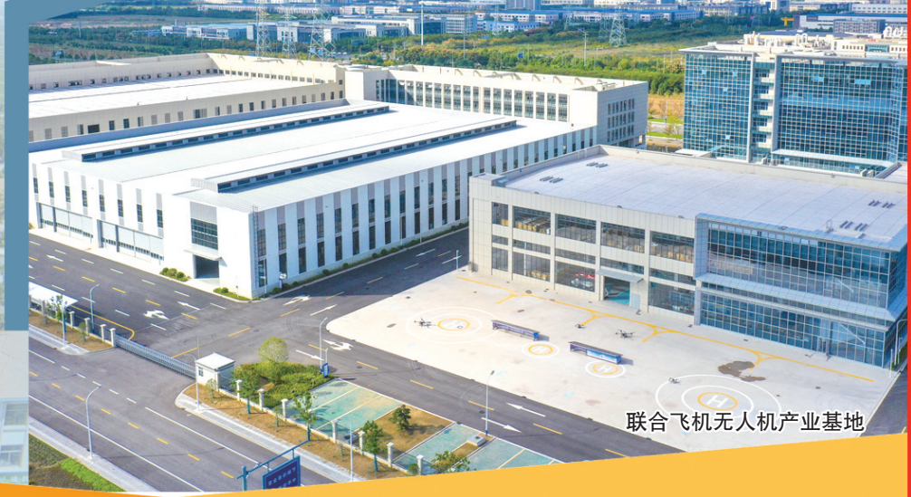
联合飞机无人机产业基地