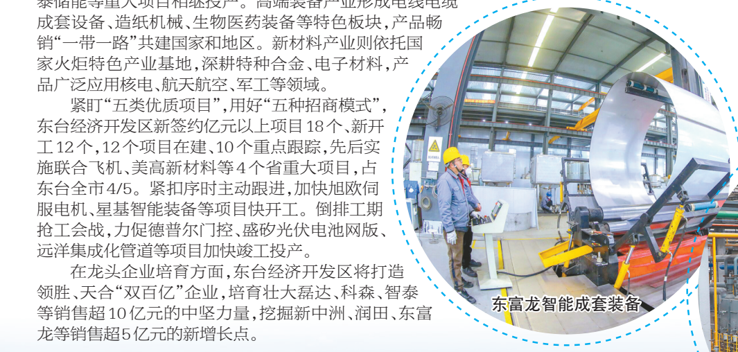
东富龙智能成套装备