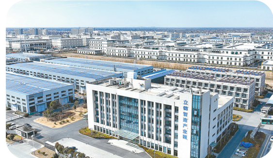
立铠精密科技(盐城)有限公司

坚持把项目引建作为重中之重,奋力推动项目数量、建设质量、投资总量“三量齐升”。“十四五”以来滚动实施重点工业项目2602个,涌现出弗迪电池、立铠精密等一批重特大项目,工业投资占固投比重较“十三五”末提升11.6个百分点。定期举办供需、金融、用工等精准对接活动,多轮次储备服务国债、再贷款等“两新”领域项目,2025年第二批15个项目预计获批资金3.72亿元,全省第4;再贷款项目158个通过国家审核,全省第2,工业技改投资连续三年保持全省前3。