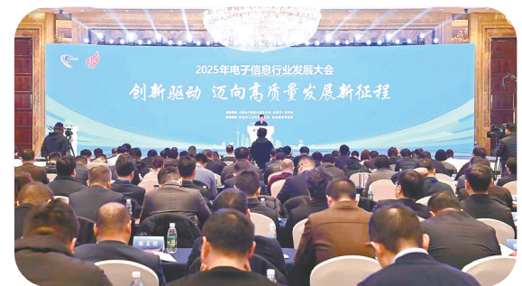
2025年电子信息行业发展大会

做强“产业链”。实施产业链培育三年行动计划,逐年更新发布产业链“四图三清单”,巩固增强晶硅光伏、风电装备、动力及储能电池等地标产业链优势地位,构建“5+8+10”产业链梯次培育格局,23条重点产业链规模超7300亿元。畅通“供应链”。从供需两端协同发力,打造盐“链”有为“十链百场千企”系列活动品牌,继续通过大带小、小托大,累计开展供需对接、产技对接、整零配套等活动146场次,推动产业链上下游协同高效发展。提升“项目链”。先后组织开展长三角数字经济招商推介、长三角新一代信息技术产业招商拜访、电子信息行业发展大会等活动,吸引长盈精密、普渡机器人等行业龙头企业接续落户,推动比亚迪、立讯精密、领益智造等头部企业深耕盐城。