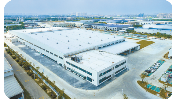
佛吉亚(盐城)汽车部件系统有限公司

1月15日,世界经济论坛公布最新一批“灯塔工厂”名单,江苏悦达纺织集团有限公司、佛吉亚(盐城)汽车部件系统有限公司双双入选,成为盐城工业发展史上又一里程碑。“十四五”以来,接续实施“智改数转网联”行动计划,加快人工智能赋能新型工业化,遍布全市的智能工厂,构成了盐城新质生产力的坚实底盘。规上工业企业实现数字化改造动态覆盖,培育先进级智能工厂136家,维信电子、立铠精密突破卓越级智能工厂,制造业“智改数转网联”推进度保持全省前列。实施5G规模化应用“扬帆”行动,2025年新创建国家5G工厂11家,新增数、累计数均列全省第3。