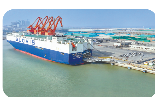
悦达起亚整车出口累计超50万台

打造中外合资“新范式”。推动全国首个合资汽车品牌合营延期,打造起全球最大海外出口基地,累计整车出口超50万台,覆盖89个国家和地区,2024年斩获合资品牌出口“三项第一”。共筑央地合作“新典范”。策应一汽集团南下战略,整合一汽奔腾技术、品牌优势和盐城汽车产业资源,建成一汽长三角唯一的新能源汽车生产基地。构建产业协作“新格局”:以“强整车、全链条”思路构建产业生态,悦达起亚底盘、内外饰、车体三大组件的本地配套占比80%以上,零部件企业实现“多品牌、多部件”配套。布局产业发展“新方向”。建成国内首个大型封闭式智能网联汽车试验场,拿下国内唯一高寒测试资质,被国务院国资委评为“大国重器”,已成为小米、小鹏、理想等新锐车企首选测试地。