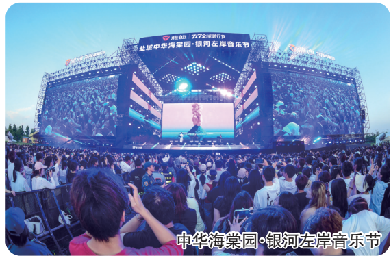
中华海棠园·银河左岸音乐节