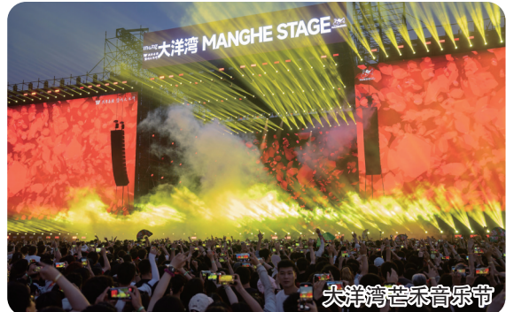
大洋湾芒禾音乐节

大洋湾芒禾音乐节、中华海棠园银河左岸音乐节音浪席卷全城，“花开盐城”“盐盐夏日”“湿地红了”“滋味盐城过大年”四季文旅IP轮番登场，丹顶鹤黄海湿地旅游节、“NICE盐城青春放飞季”“邀请同窗游家乡”“黄海一号旅游公路品牌日”等活动贯穿全年。千万元消费券激活引擎，撬动亿元消费热潮。