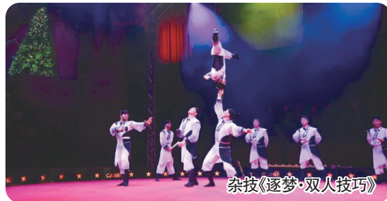
杂技《逐梦·双人技巧》

杂技《金鸟涅槃——集体倒立》《逐梦·双人技巧》获第26届意大利拉蒂纳国际马戏艺术节金奖，盐城技艺在世界舞台绽放东方华彩。2025年新增4名国家级传承人。阜宁大糕入选文化和旅游部“非遗工坊典型案例”、江苏唯一，4家单位入选第二批省级非遗工坊，“非遗融入桃花源”获省“无限定空间非遗进景区”优秀案例。篆刻、发绣等瑰宝惊艳亮相全球滨海论坛等国际舞台，古老技艺焕发新的时代光芒与国际影响力。