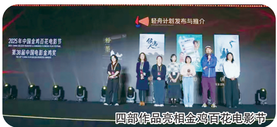
四部作品亮相金鸡百花电影节