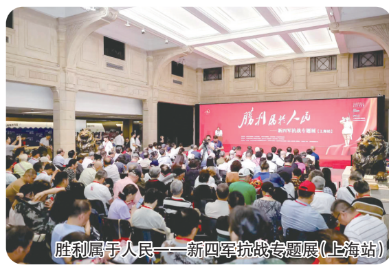
胜利属于人民——新四军抗战专题展(上海站)

《铁军忠魂——新四军历史陈列》入选纪念中国人民抗日战争暨世界反法西斯战争胜利80周年主题陈列展览特别推介展览。4家文博场馆跻身热搜百强榜，新四军纪念馆位列2025年度“全国热门纪念馆百强”第9位。精品展览一馆一特色、夜游研学双轮驱动点亮城市夜间文化版图，大思政课架起红色文化学习桥梁，文创开发出新出彩，打开文旅消费新局面。