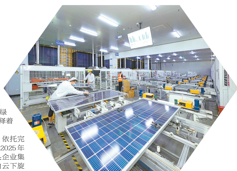
盐城正泰新能源科技有限公司生产车间

绿水青山就是金山银山。在大丰,绿色不仅是生态保护,更是发展方式与竞争优势。大丰区委全会明确“绿色低碳示范”,坚定不移走生态优先、绿色发展之路,让绿色成为高质量发展最鲜明的底色。这片土地,正用实践诠释着“生态本身就是经济”的深刻内涵。 “风光氢储”一体融合,是大丰绿色转型的生动实践。依托完整的风电产业链,这里加速推进新能源全链条发展。截至2025年10月,新能源发电装机规模稳居全市第一,多家行业龙头企业集聚,形成了年产超千兆瓦级机组的产业规模。蓝天白云下,旋转的风机与光伏板交相辉映,构成独特的“绿色能源风景线”。 零碳园区,引领未来。大丰港零碳产业园在国内率先建成园区级绿电物理可溯的“源网荷储”一体化系统,成功接入数十家规上企业,实现电碳数据实时监测。它不仅是技术高地,更是“以绿制绿”的应用场景,吸引着众多绿电需求企业入驻。在这里,每一度电的来源都可追溯,每一次减排都有数据支撑,绿色低碳从理念变成了可测量、可管理的生产实践。 从企业到园区,绿色制造蔚然成风。大丰全区累计建成国家