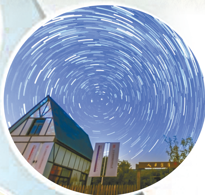
野鹿荡·中华暗夜星空保护区