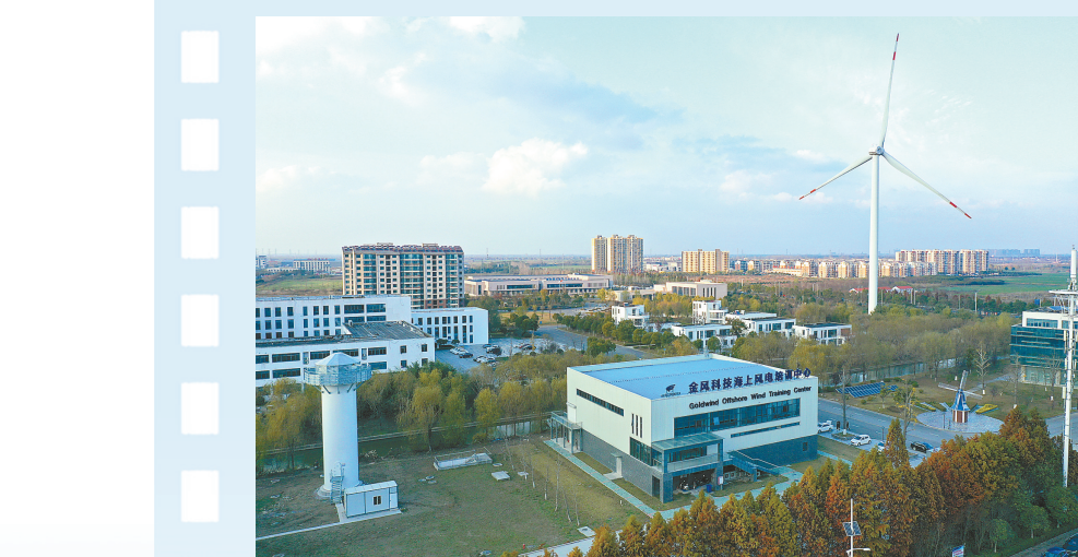
长三角一体化产业发展基地新能源科创园