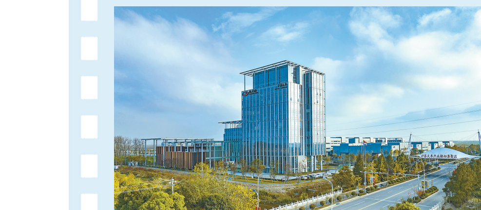
沪苏大丰产业联动集聚区