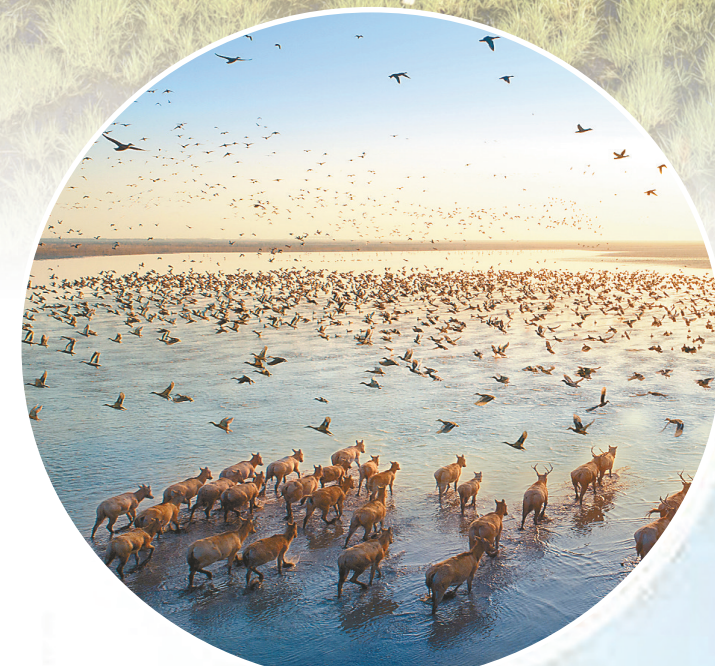
黄海湿地摄影作品《共享家园》