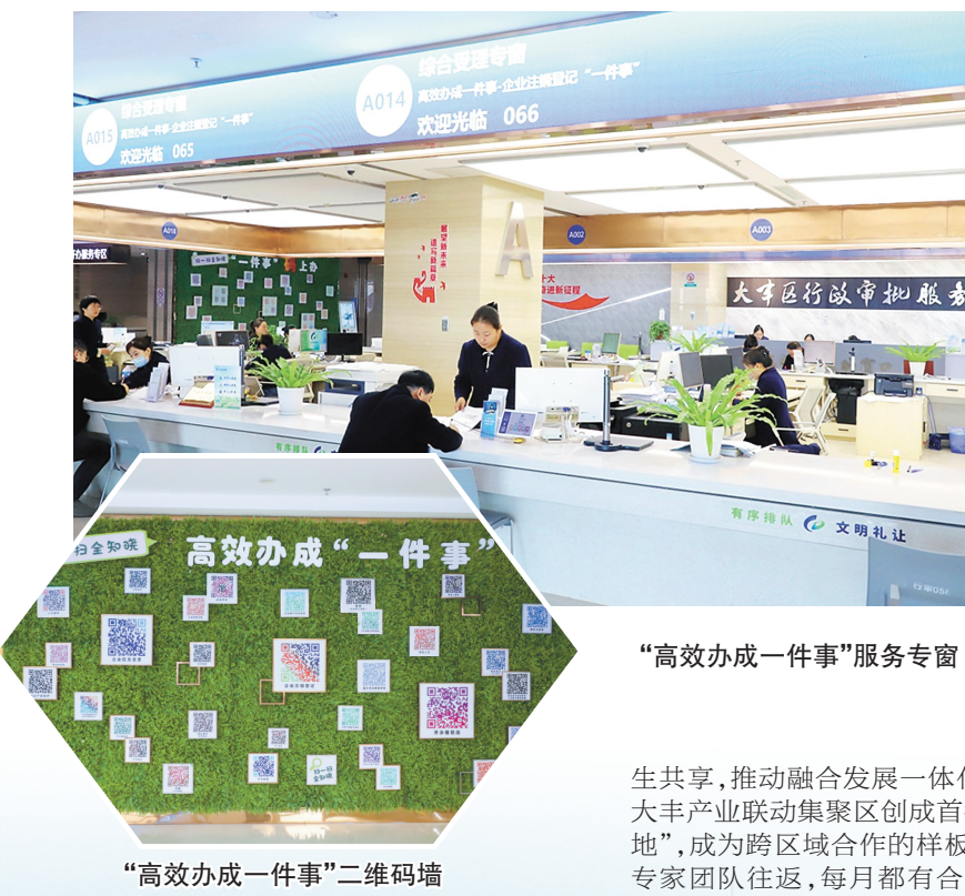
“高效办成一件事”服务专窗

开放是当代中国的鲜明标识,也是大丰发展的必由之路。大丰区委全会强调要“更好服务和融入新发展格局”,以更高水平开放塑造发展新优势,在长三角一体化等国家战略中找准定位、主动作为。敞开大门,迎的是八方来风,更是发展机遇。 对接上海,是大丰开放合作的“关键一招”。通过深化产业协同、科创联动、民生共享,推动融合发展一体化更“深”、更“实”。沪苏大丰产业联动集聚区创建首批“国家绿色产业示范基地”,成为跨区域合作的样板。每周都有来自上海的专家团队入驻,每月都有合作项目取得进展,“同城化”效应日益显现。 通道建设,夯实开放根基。大丰正加快江苏沿海中部枢纽港建设,打造大进大出、快进快出的战略支点。畅通的物流通道,不仅服务于本地产业,更辐射广阔腹地,提升区域综合承载能力。码头上,集装箱装卸高效有序,航线网络四通八达,这里不仅是货物的集散地,更是开放信心的展示窗口。 优化生态,凝聚优质资源。商务部门着力营造一流营商环境,在政策、平台、要素保障上持续发力。抢占绿色贸易新赛道,推动外贸结构优化和业态创新,让大丰成为外资青睐、外贸活跃的开放热土。从审批提速到“一站式”服务,从精准招商到全周期护航,优质的“软环境”正拥有着开放的“硬实力”。