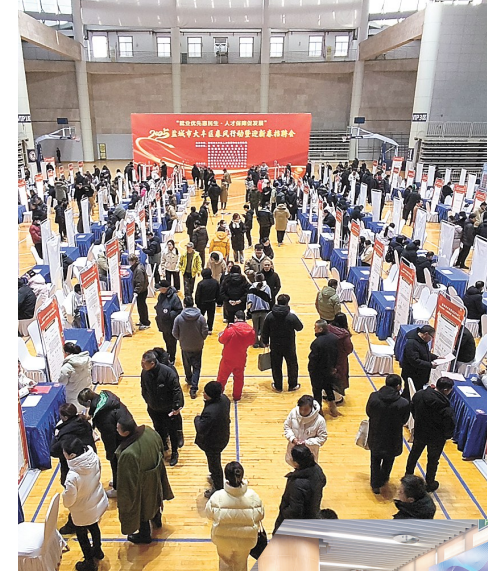
2025年大丰区新春招聘会现场