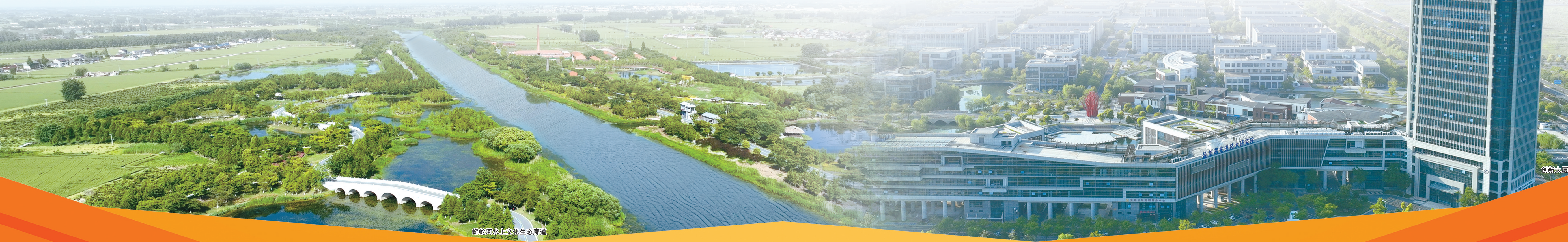
蟒蛇河水上文化生态廊道

湖涌盐都,风正帆悬。站在新的历史起点上,盐都正以项目建设为支撑,在产业强区建设的征程上阔步前行。产业升级的蓝图已绘就,绿色转型的路径愈清晰,民生改善的成果渐丰硕。这片土地,正以坚定的步伐迈向高端化、智能化、绿色化的未来。未来,盐都将继续锚定奋力谱写现代化“水韵古邑、高新盐都”建设新篇章的目标,以更开放的姿态拥抱世界,以更坚定的步伐迈向绿色,以更务实的举措惠及民生,在现代化新征程中奏响奋楫争先、勇立潮头的时代强音!