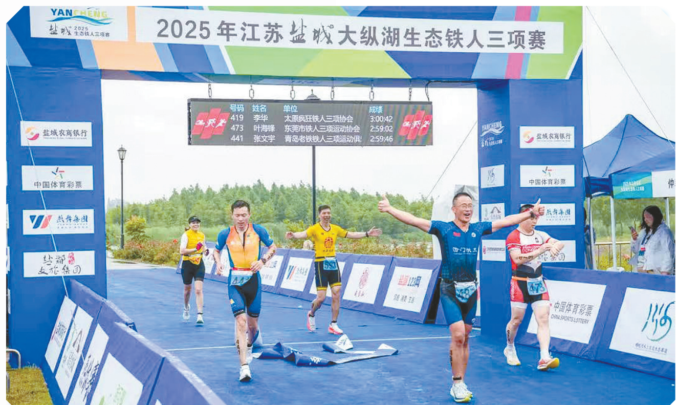
大纵湖生态铁人三项赛

湖涌盐都,风正帆悬。站在新的历史起点上,盐都正以项目建设为支撑,在产业强区建设的征程上阔步前行。产业升级的蓝图已绘就,绿色转型的路径愈清晰,民生改善的成果渐丰硕。这片土地,正以坚定的步伐迈向高端化、智能化、绿色化的未来。未来,盐都将继续锚定奋力谱写现代化“水韵古邑、高新盐都”建设新篇章的目标,以更开放的姿态拥抱世界,以更坚定的步伐迈向绿色,以更务实的举措惠及民生,在现代化新征程中奏响奋楫争先、勇立潮头的时代强音!