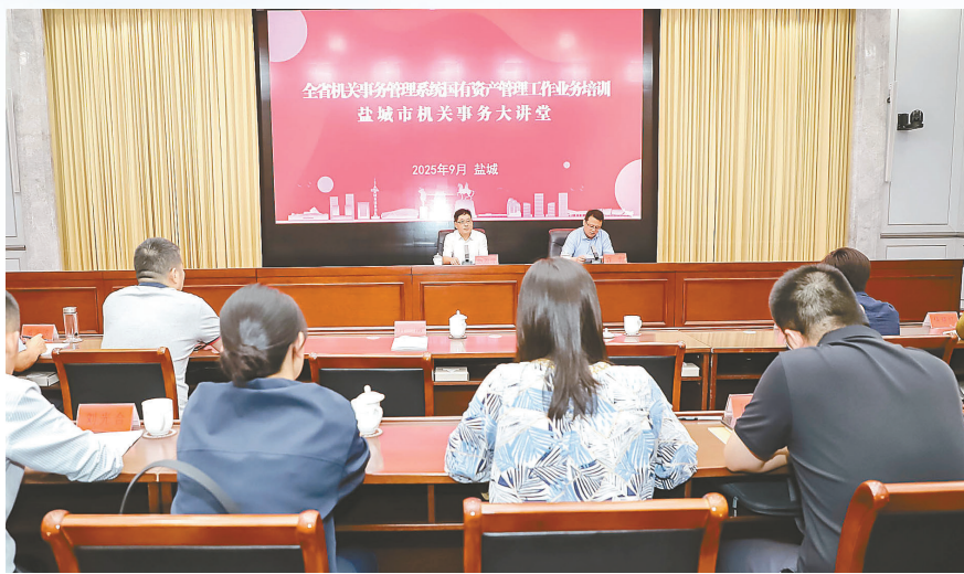
全省机关事务系统国资管理业务培训、盐城市机关事务大讲堂联合成功举办。

盐城市人民检察院等我市8家单位创建国家节约型公共机构示范单位,创建数量并列全省第一。碳普惠推介深入开展,4万多人加入自愿减排队伍,参与人数位列全省第二。整区公共机构合同能源托管试点项目扎实推进,大丰区“两个中心”能源托管项目于2026年1月1日正式进入托管期,其经验做法获新华社·交汇点报道推介。全市新增6个公共机构分布式光伏项目,总装机容量约1515.6kW。全年实施公共机构既有建筑围护结构、供热系统、变配电系统等节能改造项目11个,改造面积37.1万平方米,投入改造资金1598.8万元。