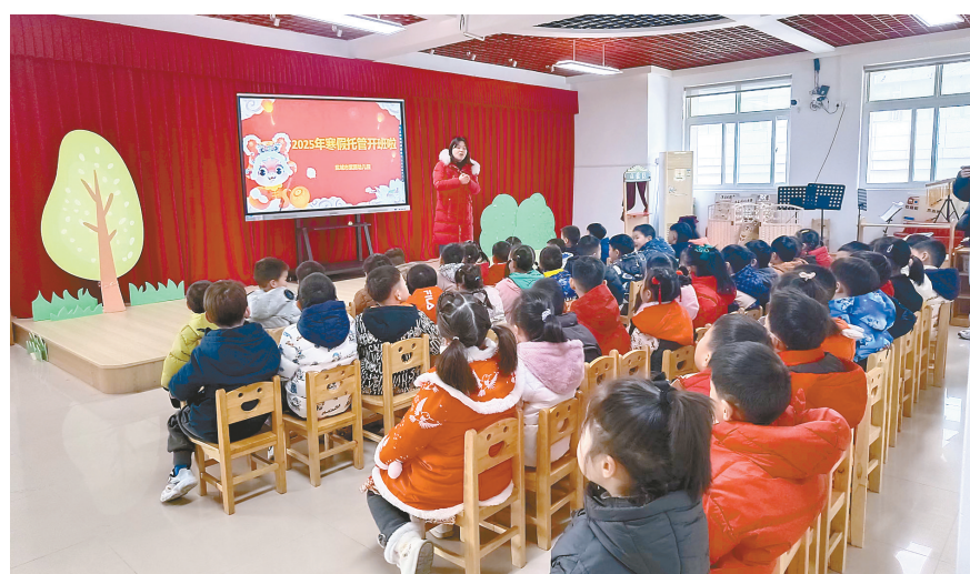
盐城市紫薇幼儿园2025年寒假托管班开班。

持续推进办公用房集中统一管理工作,市本级权属统一登记率提升至99%。健全办公用房大中修申报机制,严格执行维修改造规范,确保工程维修高效、安全、合规。通过统筹办公用房集中租用、聚力共享共用、创新管理激活低效资产效能等措施,积极探索国有资产盘活新路径,相关经验做法在国家机关事务管理局《机关事务工作动态》上刊登。在全省机关事务管理系统工程建设管理经验交流会上,市机关事务管理局就市级党政机关办公用房维修工作作专题交流发言。