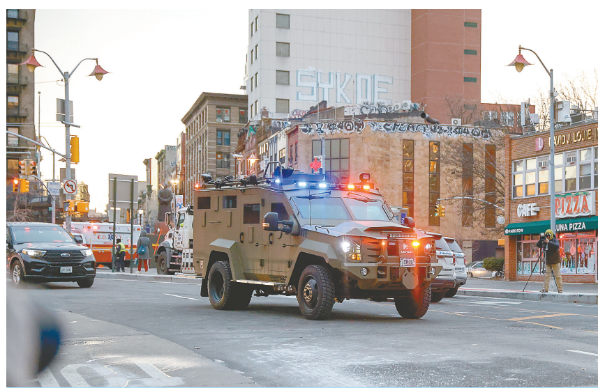
1月5日,在美国纽约,委内瑞拉总统马杜罗乘坐的装甲车前往联邦法院。

美国如此对待一国现任总统,再次让世界彻底看清了美国“强权即公理”的霸道逻辑、“弱肉强食”的丛林法则,以及践踏国际法、惯于扮演“国际裁判”的虚伪面目。