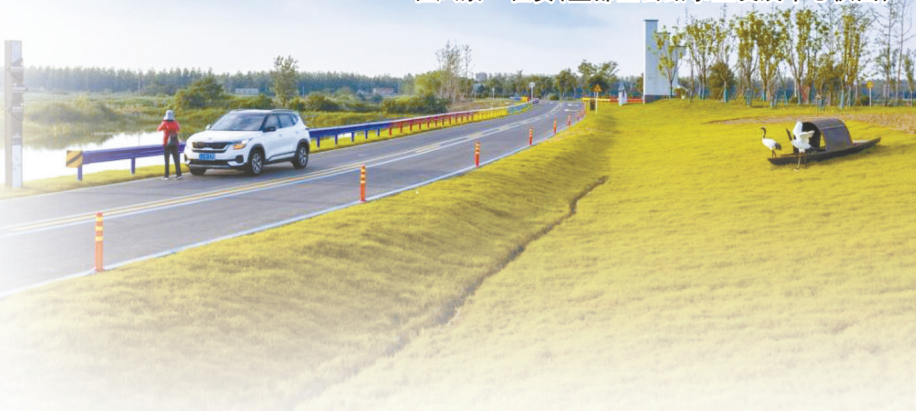
乡村旧道焕新颜