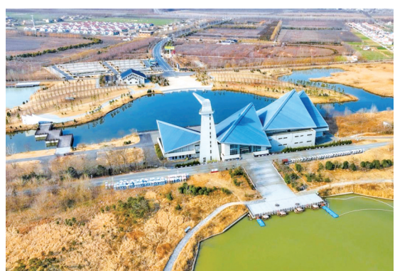
穿行丹顶鹤湿地生态旅游区