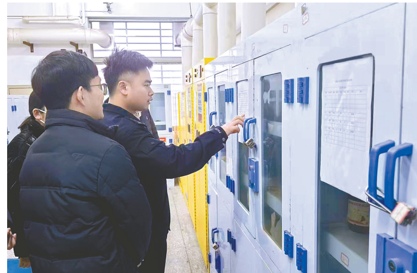
仔细核对采购台账与实际存量的一致性