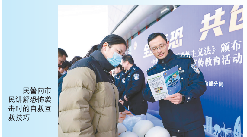
民警向市民讲解恐怖袭击时的自救互救技巧

今年是《中华人民共和国反恐怖主义法》颁布十周年。为进一步普及反恐怖主义法,全面推进依法反恐,切实增强全民反恐防范意识,营造反恐防恐浓厚氛围,12月27日,盐城市公安局盐都分局在全区范围内组织开展反恐集中宣传教育活动。