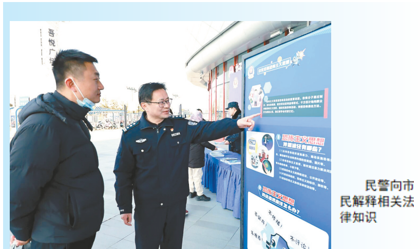
民警向市民解释相关法律法规知识

校园安全无小事,守护成长不松懈。下一步,亭湖公安将持续常态化开展校园安全检查与宣传指导,织密安全防护网,筑牢安全根基,以实际行动守护师生平安,为平安校园建设贡献公安力量。