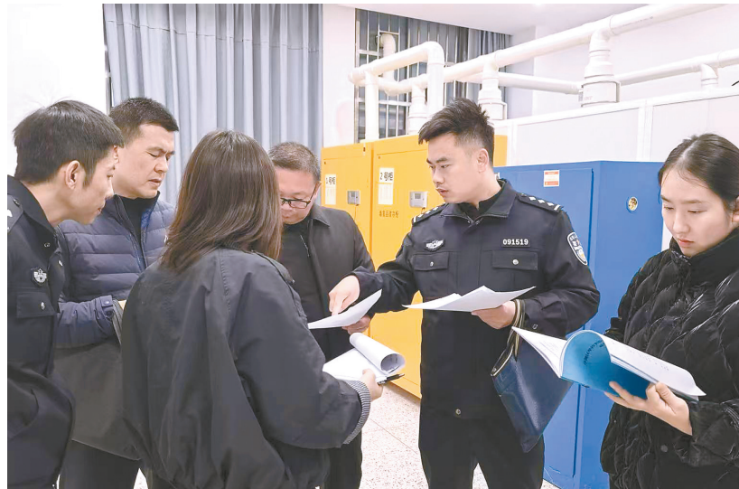
普及易制毒化学品安全管理相关法律法规

本报讯(潘霖 仇才波)为强化校园危险化学品的监管力度,规范校园安全管理工作,有效预防各类危化品安全事故发生,切实保障广大师生的人身安全,连日来,盐城市公安局亭湖分局联合教育部门,对辖区学校化学实验室开展专项安全检查。