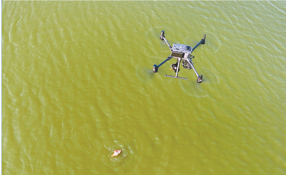
无人机在模拟巡查时发现有人“落水”