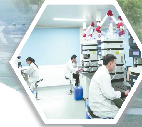
国家高新技术企业——亚邦爱普森药业