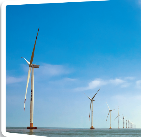
绿能澎湃的海上风力发电