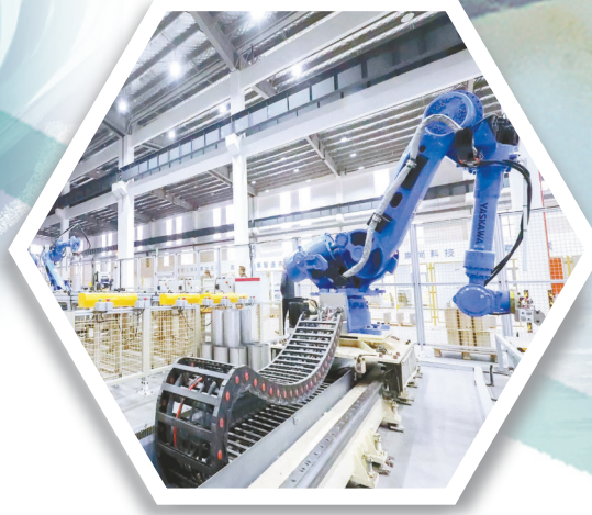
全市首家“黑灯工厂”——德森汽车部件