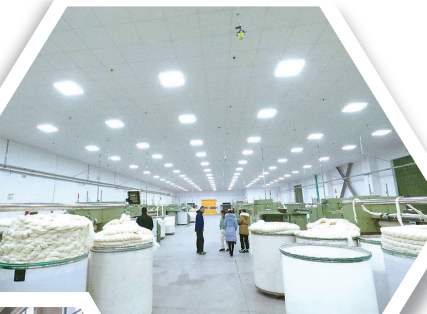
国内羊毛行业龙头企业——金盟纺织

风正劲,帆已满。“十四五”收官在即,“十五五”蓄势待发。站在新的起点,响水将以改革再出发的昂扬姿态,牢记嘱托、感恩奋进,苦干实干、奋勇争先,加快推动工业经济实现更高质量、更有效率、更可持续的发展,为“十五五”时期县域经济腾飞贡献更加强劲的工业力量!