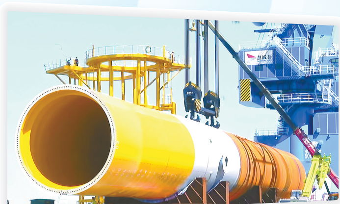
海工装备行业新标杆——天能海洋重工