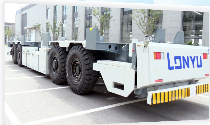
国家级专精特新“小巨人”企业——朗誉机器人