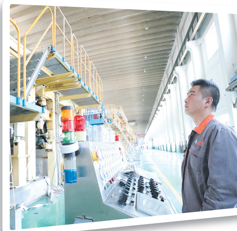
省绿色工厂——富星纸业