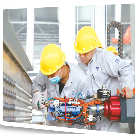
打破外资品牌长期垄断——宝丰新能源