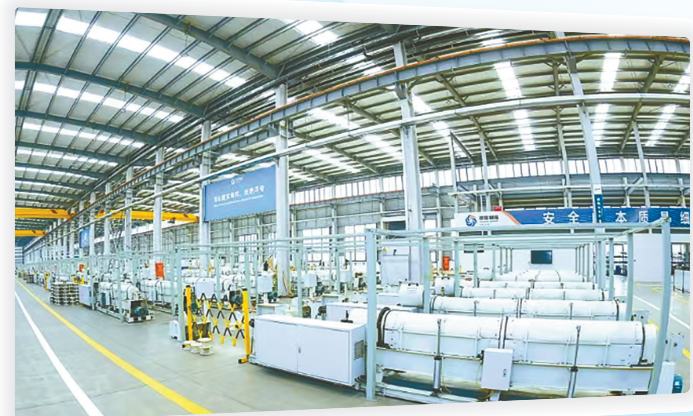
承担国家医用钢丝绳标准制定——荣星制绳