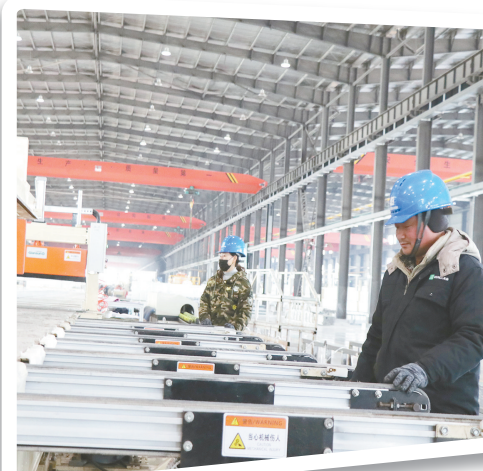
国家级绿色工厂——库纳新能源