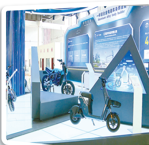
拥有全球先进环保的工艺——波特车业