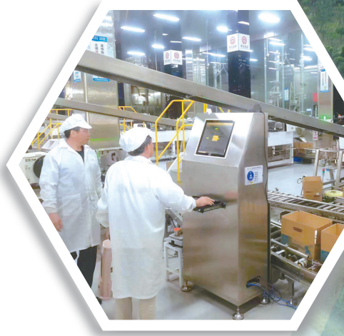
国内工业海盐生产规模最大的企业——海精盐厂