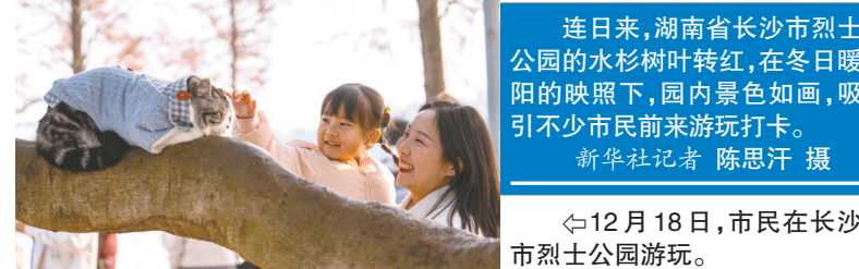
连日来,湖南省长沙市烈士公园的水杉树叶转红,在冬日暖阳的映照下,园内景色如画,吸引不少市民前来游玩打卡。