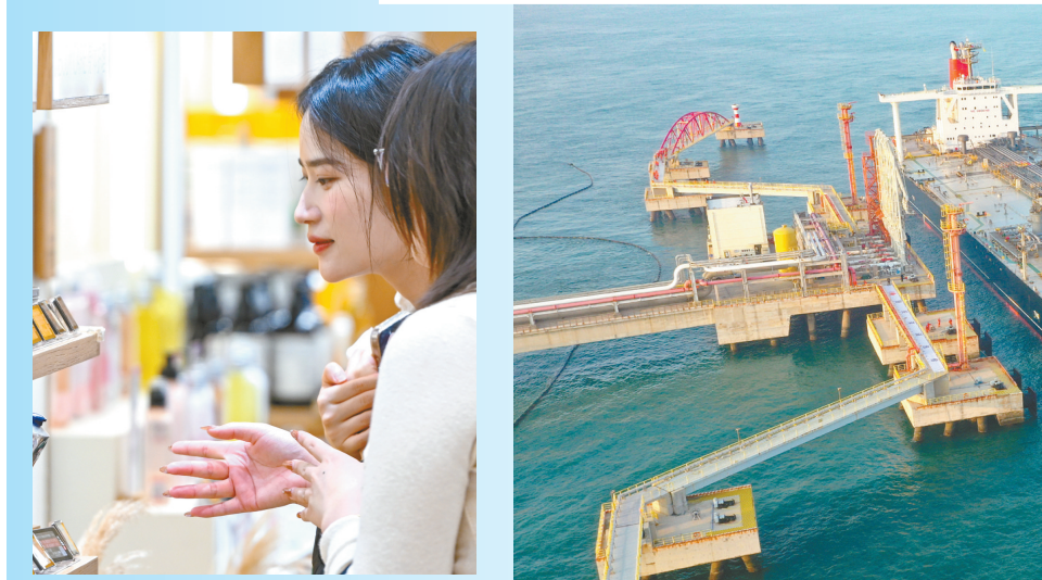
12月18日,一艘装载着石化原料的外籍船舶泊入国投洋浦油储码头30万吨级原油泊位(无人机照片)。