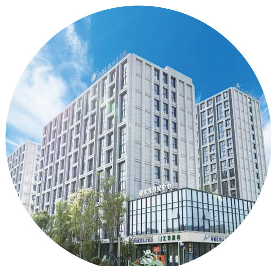
亭湖区汇菁人才公寓

宜居,是城市最温暖的追求。十年来,盐城将“人民城市”理念深植发展,持续铺展舒适便利、温情可触的宜居画卷。 安居是起点,优居是方向。从盐都合心花苑到亭湖万户新村,老旧小区连片改造“改”出向往生活;亭湖汇菁人才公寓筑巢引凤,悦达“悦珑铂苑”探索品质居住,满足多元安居需求。 社区服务同步升级——东台新坝社区织密“一站六点”服务网,北社社区打造全龄友好空间,让社区成为可依托的温暖港湾。大丰中山医院苏北健康管理中心推动“医疗+生态”融合,让健康福祉触手可及。 从老旧小区“幸福梯”加装到路网延伸,再到“一刻钟生活圈”完善……每项民生举措都化作市民可感的笑容与安稳。宜居不止于愿景,更在于持续的行动,盐城正用温暖书写城市发展的民生篇章。