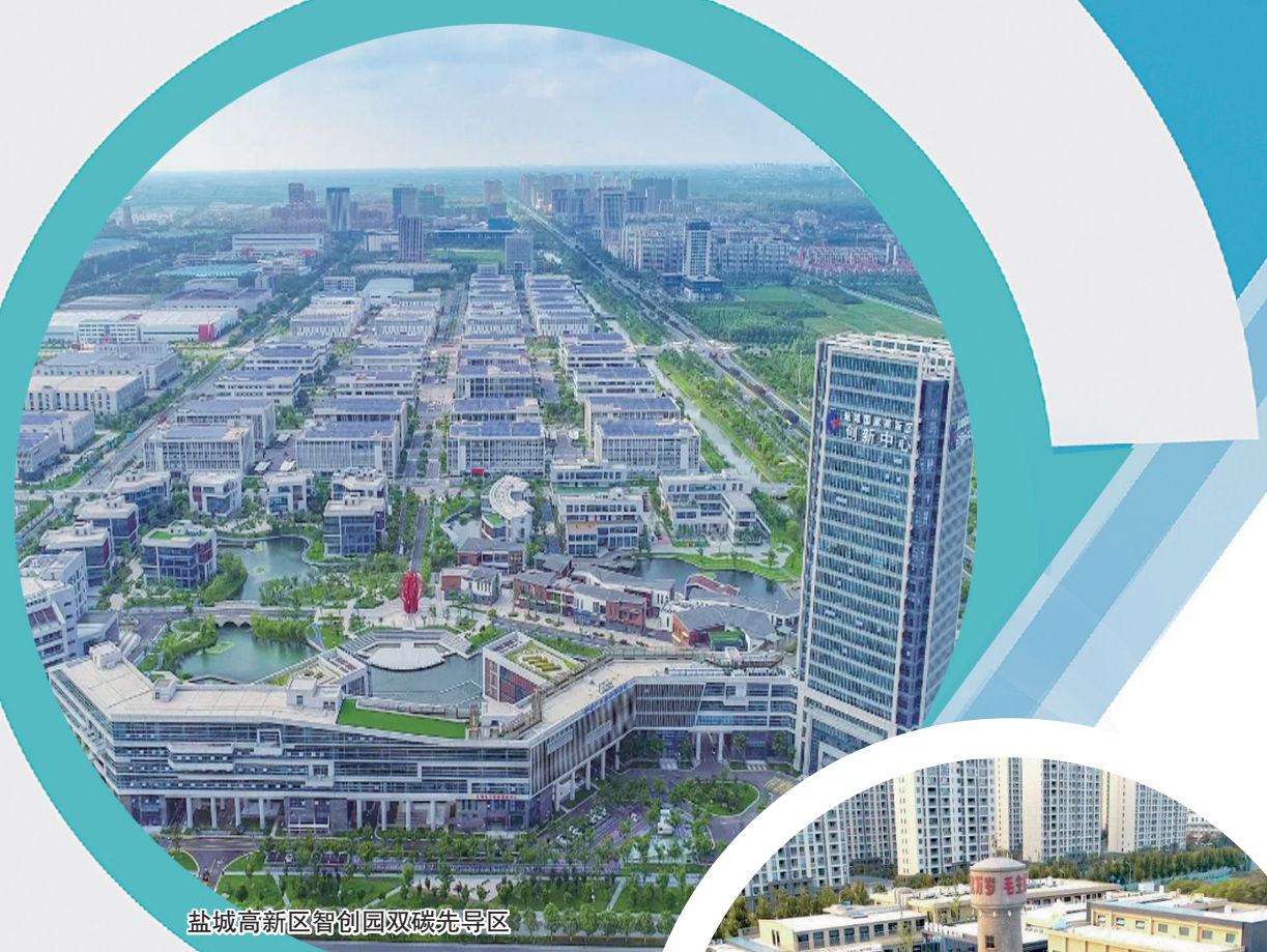
盐城高新区智创园双碳先导区