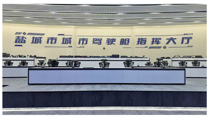
城市驾驶舱指挥大厅