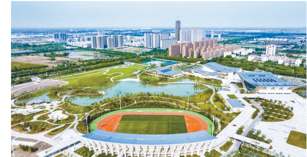
阜宁县中心避难场所

安全是发展的底线。盐城统筹城市发展与安全,以精细化治理与智慧化赋能,全方位筑牢城市安全防线,让“韧性之城”底色愈发鲜明。 城市生命线安全工程构建智慧监测体系,城镇燃气整治与“气改电”行动拧紧安全阀门,守护万家烟火;市区供水保障升级、防汛防台工作落地,阜宁县中心避难场所筑牢应急防线;市青少年安全教育馆开展沉浸式科普,全方位守护健康成长。同时,185个精管善治项目落地见效,物业服务提升行动惠及万千居民。