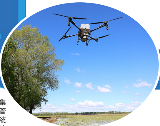
2025年5月21日,在北大荒集团黑龙江绥滨农场有限公司东井管理区,操作员操控搭载北斗导航系统的植保无人机,对即将施返青肥的地块进行打点。

中国就业市场正站在结构性重塑的关键节点。未来五年,产业升级、技术变革、人口结构调整等多重浪潮交织,就业生态的核心逻辑将被改写。新华社记者广泛采访,从十个维度观察,勾勒中国就业市场的变化和机遇,提供立体的未来职业趋势“导航图”。