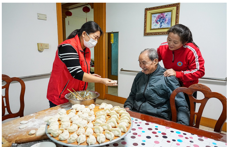
2025年10月23日,养老服务员上门为山东省淄博市张店区马尚街道博大花园社区老人提供助餐服务。

取消超时罚款,通过AI安全防控系统把风险前置,扩大新就业形态人员职业伤害保障试点……政策与平台协同努力下,新就业形态劳动者权益将更有保障。