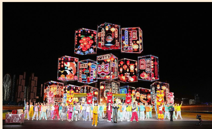
11月21日,演员在闭幕式现场表演。