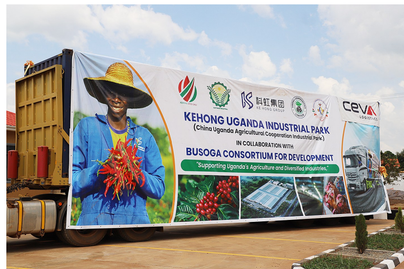
乌干达政府11月20日在乌东部卡穆利区举行仪式,庆祝首批11吨输华干辣椒正式启运。这批品种源自中国,产于乌干达的干辣椒产品将通过海运发往上海。

阿拉格齐说,伊朗20日向国际原子能机构总干事发出了一封正式信函,宣布开罗协议不再有效。