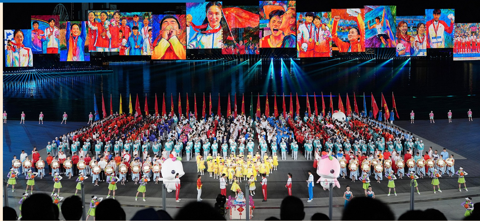
11月21日,第十五届全国运动会闭幕式在广东深圳前海欢乐剧场举行。这是当日拍摄的闭幕式现场。