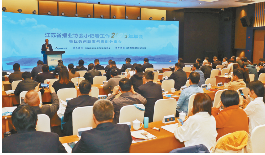
省报业协会小记者工作2025年年会暨优秀融合创新案例表彰分享会现场

近百名小记者现场观摩、采访记录、互动提问,沉浸式参与让他们不再只是“看客”。这场赛事,是一次科技与