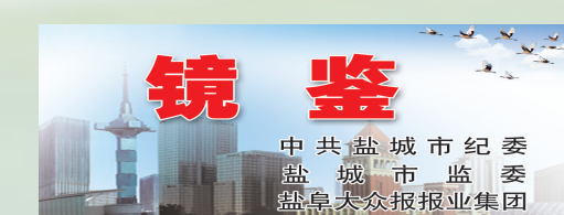
中共盐城市纪委监委 盐城市广播电视台