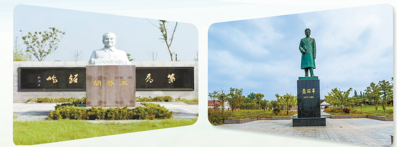
胡乔木生平陈列馆

在这片红色的沃土上,一个个响亮的名字被深情传颂,一段段光辉的事迹被深刻铭记,一份份为民的情怀被生动诠释。它们共同镌刻在城市记忆的精神浮雕之上,挺立起一座座引领风尚、烛照未来的廉洁文化新地标。目前,“清风盐城”廉洁文化教育专线体系日臻完善,已成功打造并推出覆盖东台、建湖、射阳、阜宁、滨海、响水、大丰、盐都、亭湖、盐城经开区、盐南高新区等地的特色线路,各具风采、内涵丰富。今天,“清风盐城”廉洁文化教育融媒地图正式上线,敬请关注!