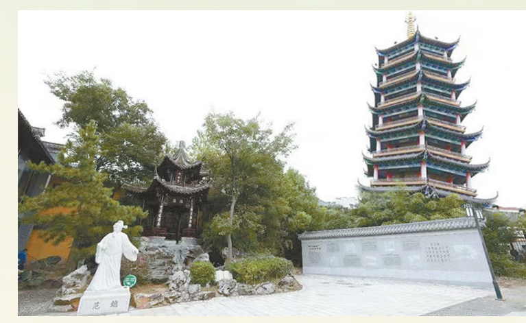
庙湾古城(却金亭—阜宁廉史馆)