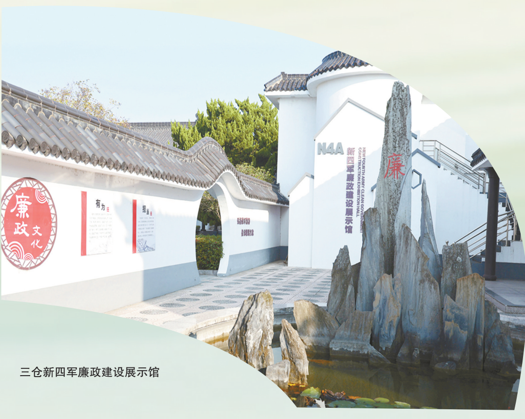
三仓新四军廉政建设展示馆