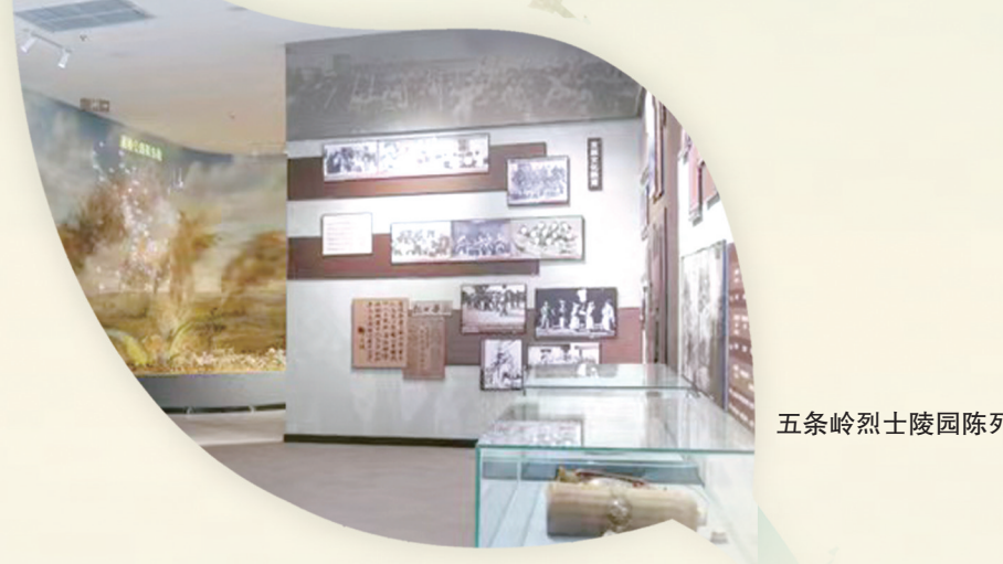
五条岭烈士陵园陈列馆