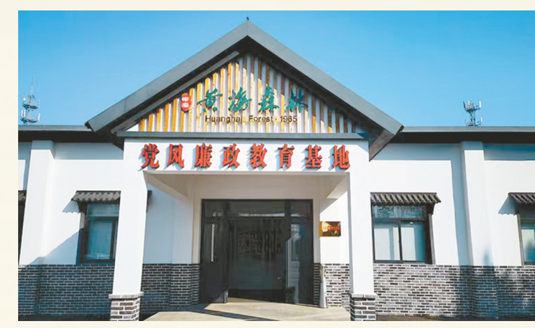
黄海森林党风廉政教育基地