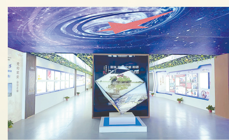
五星街道五星村村史馆