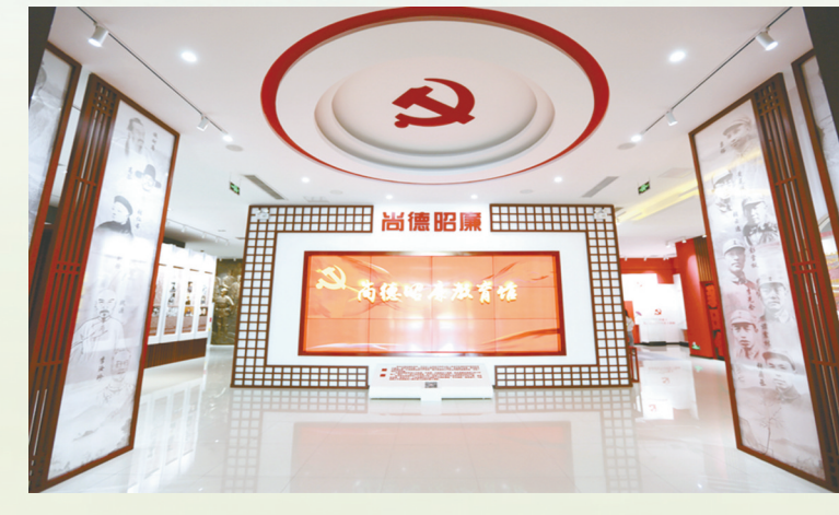
盐城市尚德昭教育馆

响水县廉洁文化教育专线贯通黄圩镇云彰村党性教育基地、“清风响水”家风主题公园与吕息烈士革命事迹陈列馆,将红色血脉与清廉家风融为一体。它以实诚课堂淬炼党性初心,用淳厚家风涵养浩然正气,让信仰之光与清廉之风交相辉映,激荡起代代相传的红色廉洁文化强音。