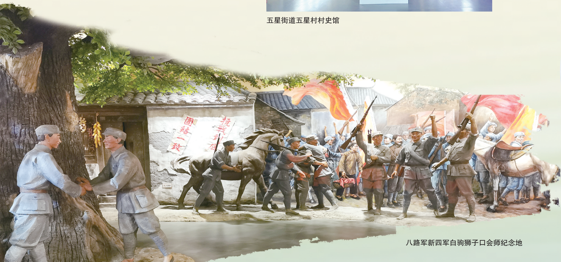
八路军新四军白驹狮子口会师纪念地