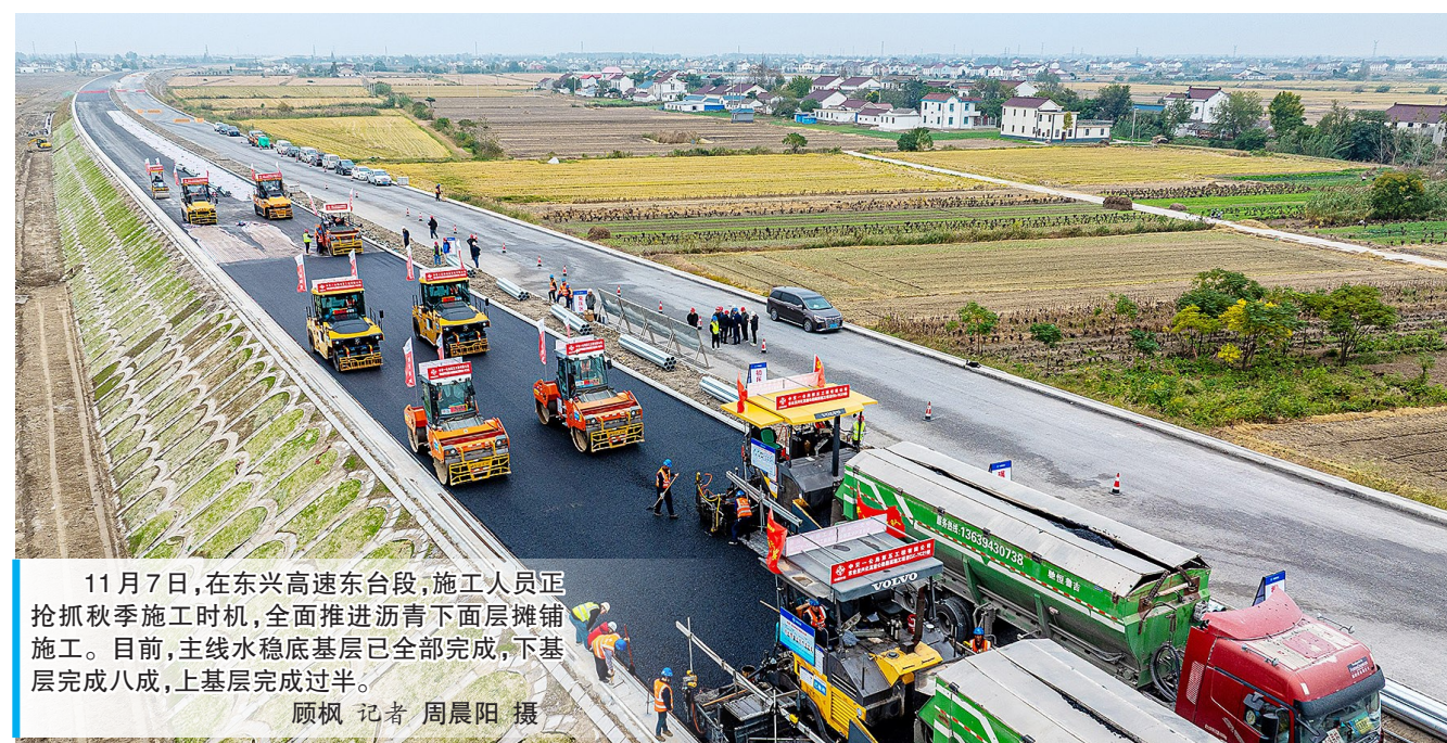
11月7日，在东兴高速东台段，施工人员抢抓秋季施工时机，全面推进沥青下面层摊铺施工。目前，主线水稳底基层已全部完成，下基层完成八成，上基层完成过半。

据悉，本次活动聚焦“学习贯彻党的二十届三中全会精神，以高质量党建推动进一步全面深化改革”“深入贯彻中央八项规定精神，持续深化作风建设，整治形式主义为基层减负”“修好‘三门课’，加强年轻干部教育引领”三大主题，自今年5月启动以来，共征集769个优秀案例，精选三个类别的十大示范案例进行现场展示。 (下转2版)