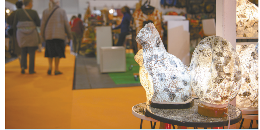
这是11月5日在德国柏林举办的“柏林巴扎”上拍摄的手工艺品。当日,“柏林巴扎”国际工艺展开幕,来自世界各地的约500家制造商和零售商参展。本届展会将持续至11月9日。新华社记者 张豪夫 摄

本届伦敦世界旅游交易会4日至6日在英国伦敦埃克塞尔展览中心举行。中国展区由中国驻伦敦旅游办事处牵头组织,汇聚56家文旅企业及8家航空公司联合参展。